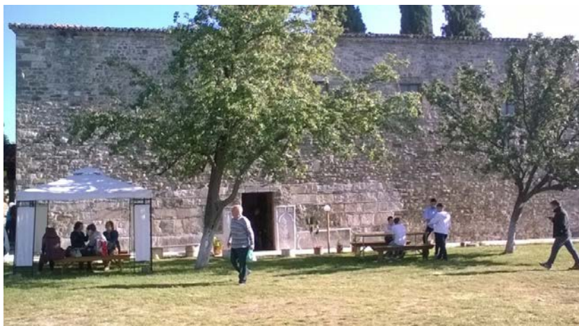
Црква Св. Јована Владимира у Елбасану