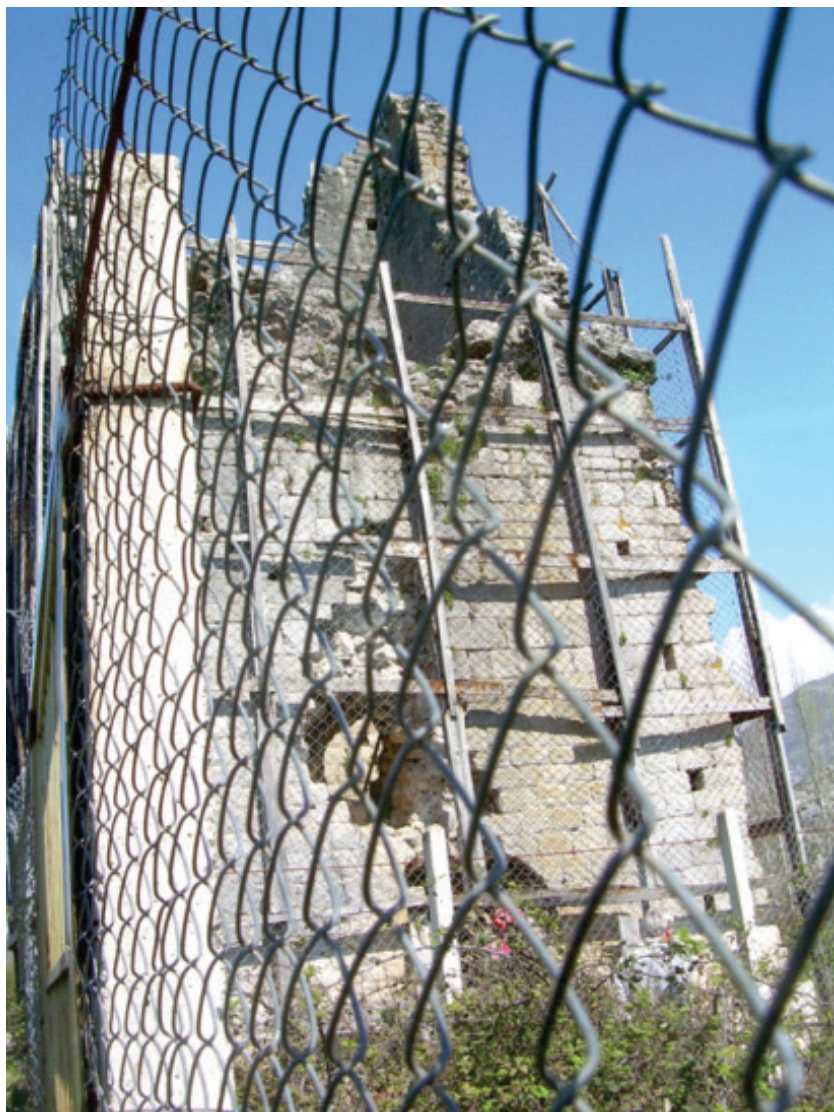
Остаци српске тврђаве на 40 километара од Скадра

13 километара, потом смо организовали чишћење и уређење околног простора богомоље. Звао сам и нашу амбасаду у Тирани, да дођу и да се увере, да нешто заједно учинимо у славу предака.