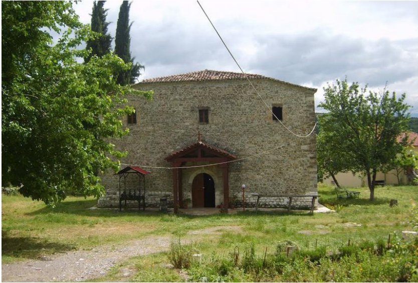
Манастир Светог Јована Владимира у Елбасану, 11. век

Личност краља српскога, Јована Владимира, рођеног 970. и после хиљаду година од његовог мученичког страдања, не престаје да интересује историчаре, архиваре, и науку и цркву.