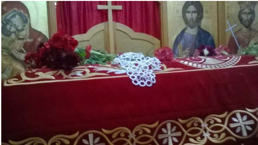
Ђивот са моштима Св. Јована Владимира у цркви у Елбасану, коју је изградио српски краљ

У порти цркве у Елбасану пристиже народ. Почиње бденије у светитељевој цркви. Ту су православни из Тиране, Скадра, Драча, Фира, али и Македоније, Србије, Црне Горе. Као да светитељ сједињује оне који у генима носе истокрвну љубав и корен.