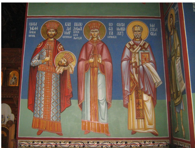
Фрескотис св. Јован Владимир, жена му Косара и св. Никола у цркви у Бару