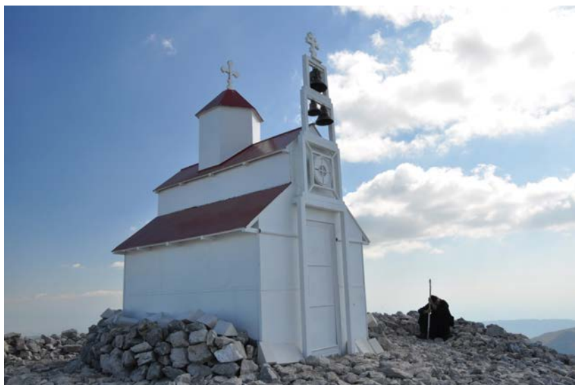
Црква Св. Тројице на Румији

крст, кога носи члан породице Андровић, иза њега иде православни свештеник, и остали верници. Међу походницима су традиционално и католици и муслимани тог краја. Учесници у поворци пјевају: „Крста носим, Бога молим, Господи помилуј”.