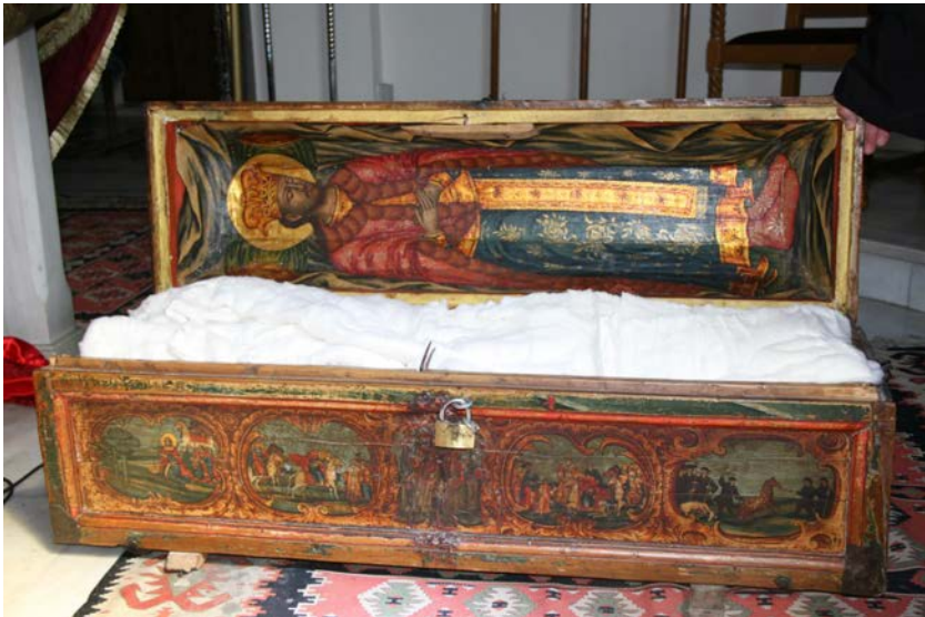
Саркофаг у којем почивају мошти св. Јована Владимира

Записао је поп Дукљанин да у цркви Свете Марије у Крајини (Пречиста Крајинска) постоји књига добрих дела и чудеса Владимирових, приказаних по хронолошком реду. Свети Јован Владимир је показао светачке моћи још за живота – на његову молбу Бог је уништио змије од којих му је војска страдала, а његов светачки ореол је нарочито био изражен непосредно после његове смрти. Кнез Владимир је у Летопису попа Дукљанина више пута назван блажени, што је први степен светости и три пута sanctus/свети/ . Међутим, не постоји сачуван документ о чину канонизације”.