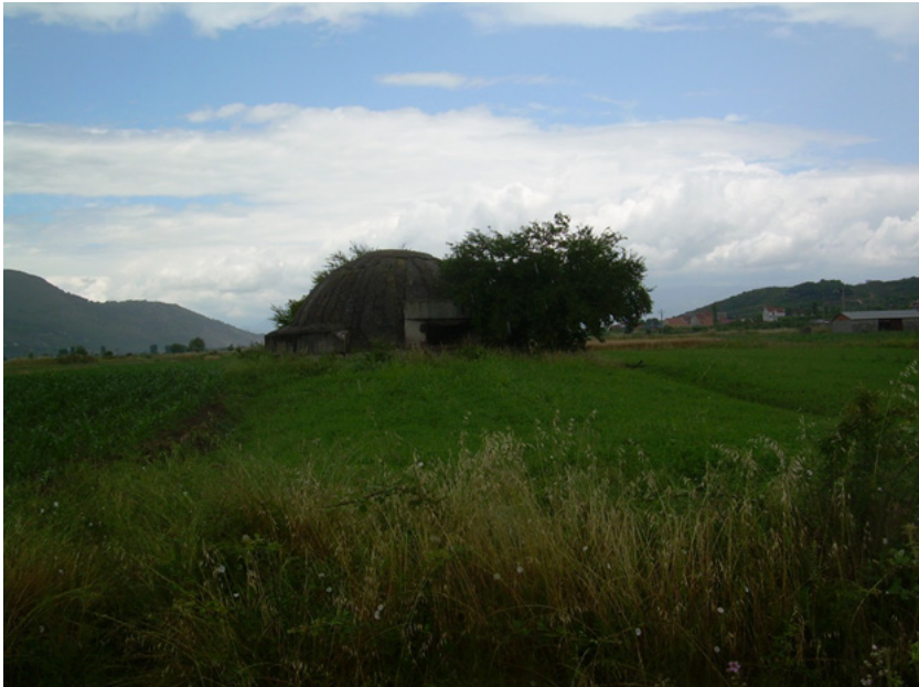
Бункери једноумља развејани по Албанији

Пре него што започемо причу о северном делу поменуте државе наше читаоце треба укратко упознати са историјом Албаније, поготово, скадарског подручја, које је једно од најбогатијих и најочуванијих простора у овом делу Европе.