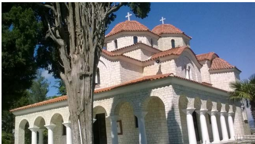
Црква Св. Влаха у Драчу изграђена на месту древног српског манастира