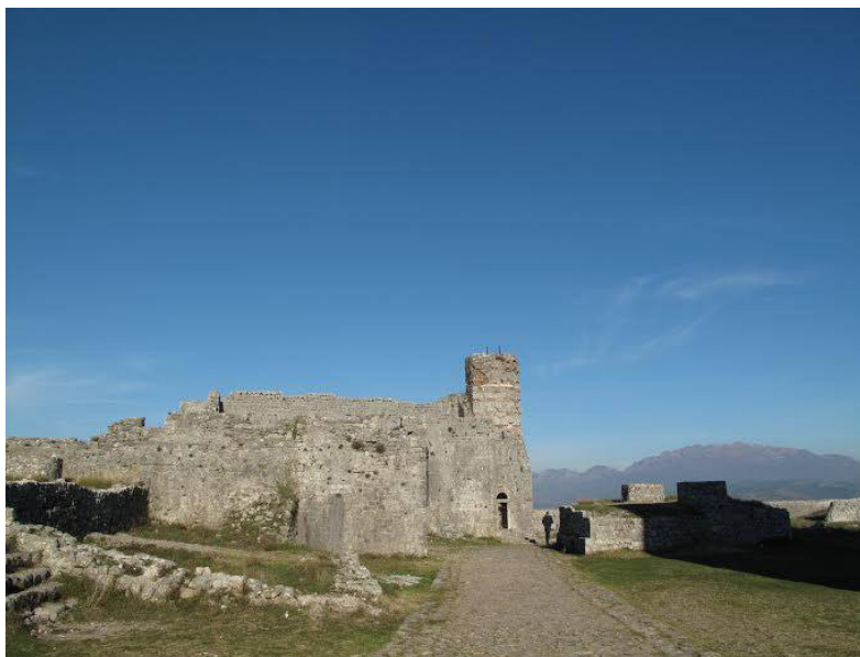
Црква Св. Архиђакона Стефана у срцу древног Скадар-града