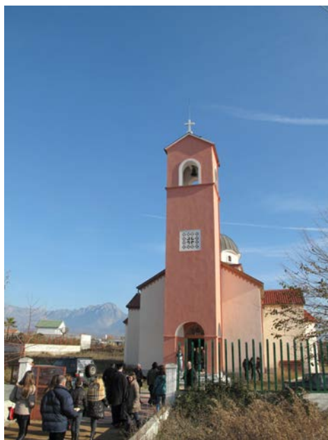
Новоизграђени храм Св. Тројице у селу Врака у близини Скадра