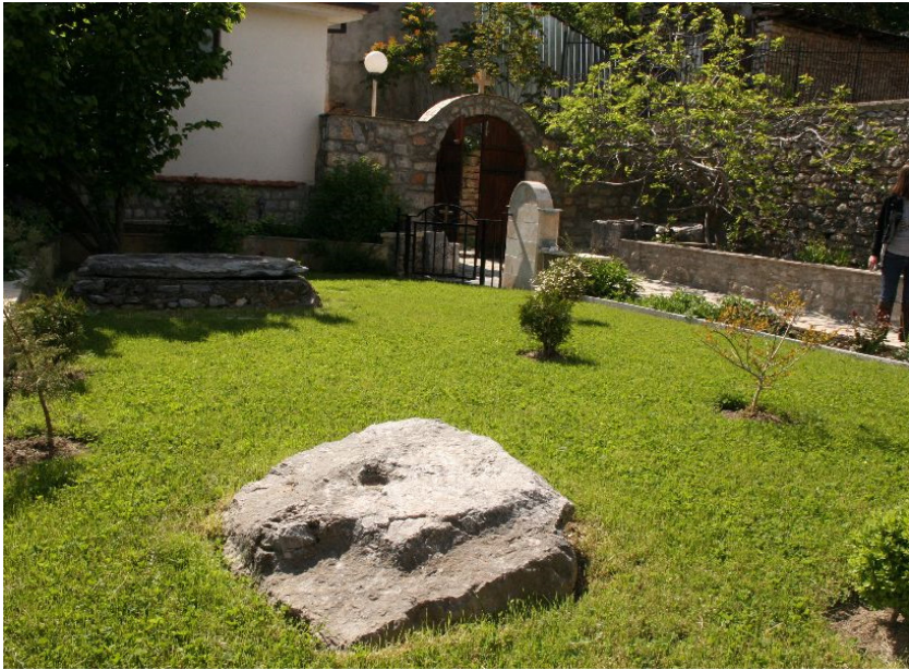
Порта цркве Богородице Челнице у Охриду