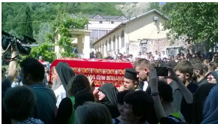
Литија око манастира Св. Јована Владимира у Елбасану

Свечари из Србије запалили су славску свећу на литургији у Елбасану. Било је у том пламену небеских искри... и неке нове снаге! Светитељска порука за нас Србе, грешне пред Богом. Портал Српска РУ, јуни 2016.