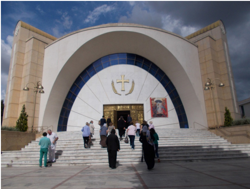
Саборни храм у Тирани, где се налази једна подлактица Св. Јована Владимира и део моштију Св. Козме Етолског

Тивот српског краља био је у време злогласног Енвера Хоџе изложен пропадању, небризи и понижењу.