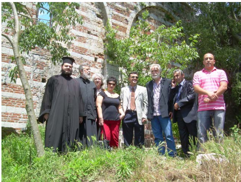
У посети манастиру Јелене Балшић, гости и домаћини

Крај нашег боравка крунисан је посетом манастиру који је у средњем веку саградила Јелена Балшић. Налази се ободу средње Албаније, поред самог Дрима. Уз пут, макадамом, испуцалим друмовима без асфалта, по глибу и рупама, разгледали смо сиве бетонске Енвер-хоџине бункере. Има их много... још стоје прогутани у шибљу или заробљени у мочварном терену. Пођосмо сви до древног манастира Јелене Балшић, али пошто је пут био тешко проходан, до краја стигосмо нас деветоро, потрпани у пространи цип Митрополије. Од манастира је остао скоро нетакнут спољашњи, темељни зид – да пркоси времену, као опомена, или зов из далеке историје. А Дрим је хитао да се сретне са Бојаном.