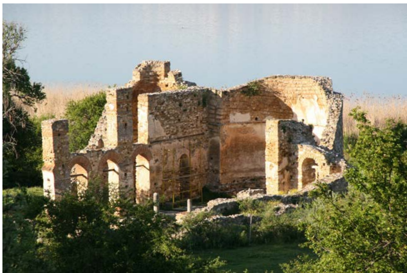
Црква Св. Ахилија у Прести, где је убијен Св. Јован Владимир (10/11. век)

Пошто је страдао као праведник, брзо је проглашен за блаженог, три године после смрти, и подједнако су га поштовали представници свих конфесија које су ту живеле.