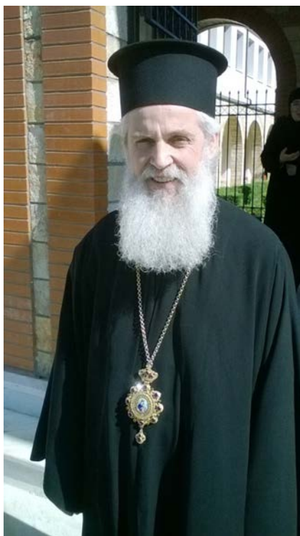
Црквени великодостојник Николај, митрополит Драча, Аполоније и Фира