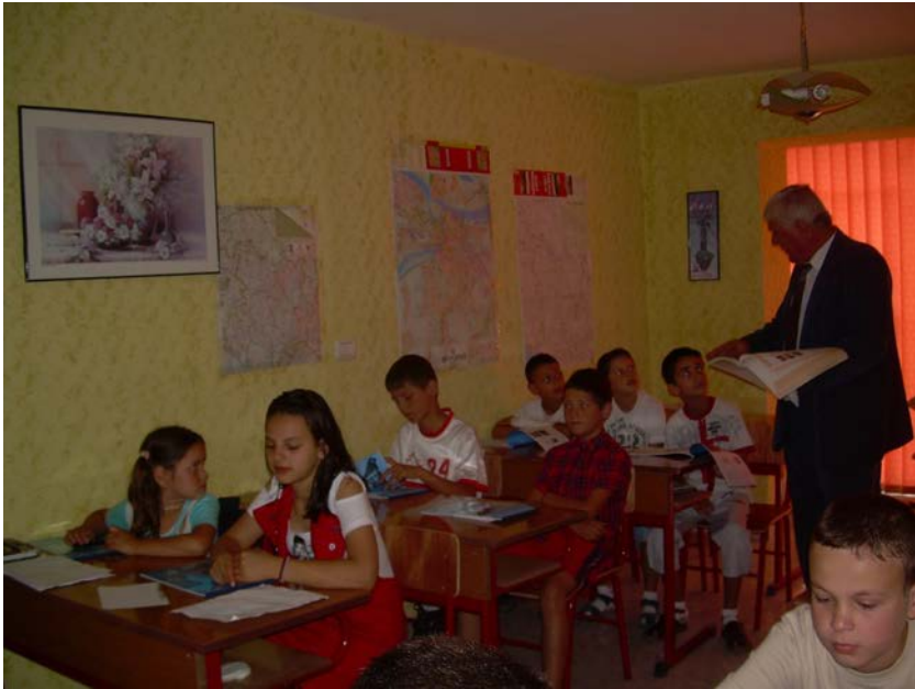
У Скадру на часу српског језика