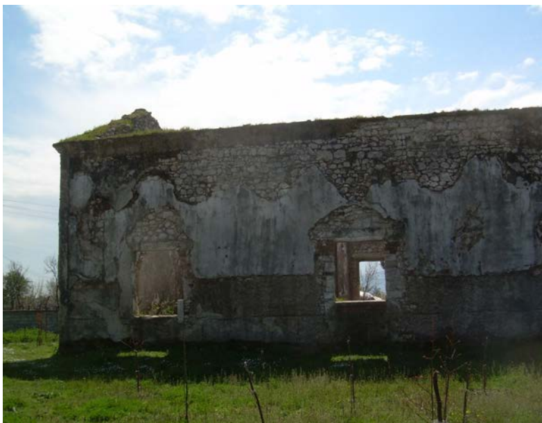
Стара порушена српска црква Св. Тројице у Враки