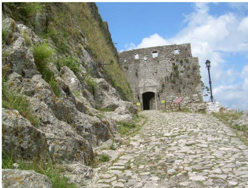
Капија древног Скадар-града

Последњи Мрњавчевић преминуо је у тада стоном Београду, код свог ујака, деспота Стефана Лазаревића. Ма колико да пишемо о прошлости која је богата, мало тога новoga бисмо могли да изнедримо, док се, наравно, не отворе архиве, или нам лондонска Краљевска библиотека, или Конгресна у Вашингтону, не врате наша стара писана документа, или Ватикан, забрањену књигу „Краљевство Словена” аутора Мавра Орбина.