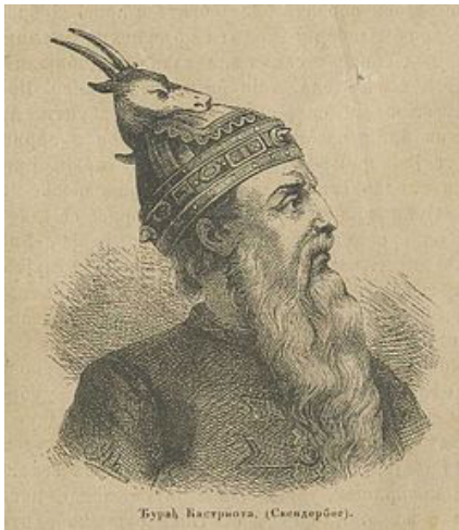
Скендербег –Ђурађ Кастриот

Када су, пре неколико година, Албанци сазнали да је Скендербег Србин и видели стара документа и повеље на српском језику, срушили су му споменик у центру Тиране и уклонили сваки траг. Касније су му споменик понови изградили, јер циљ им је да присвоје туђу земљу, славу и историју! У недостатку албанске средњевековне државе, сопственог идентитета, националних хероја, ова држава је почела са албанизацијом Скендербега и његове побуне, као што то данас покушавају са Св. Јованом Владимиром. Историјски подаци сведоче да је Скендербег био Србин, писао и говорио српским језиком, помагао је манастир Хиландар, као и цела његова породица.