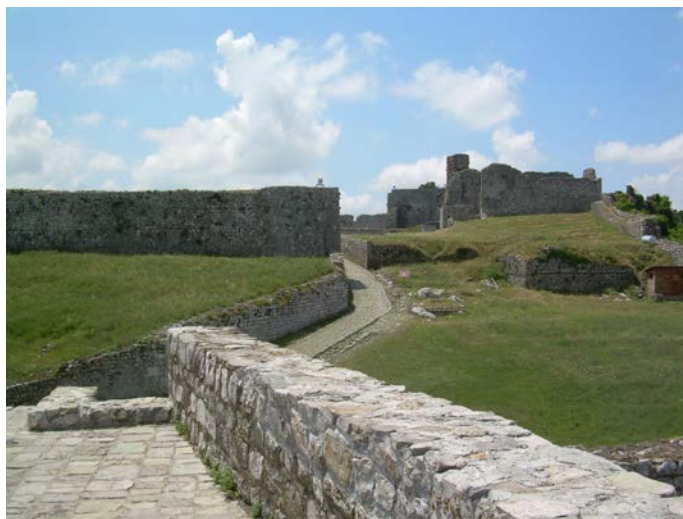
Древни Скадар-град, десно црква Св. Архиђакона Стефана