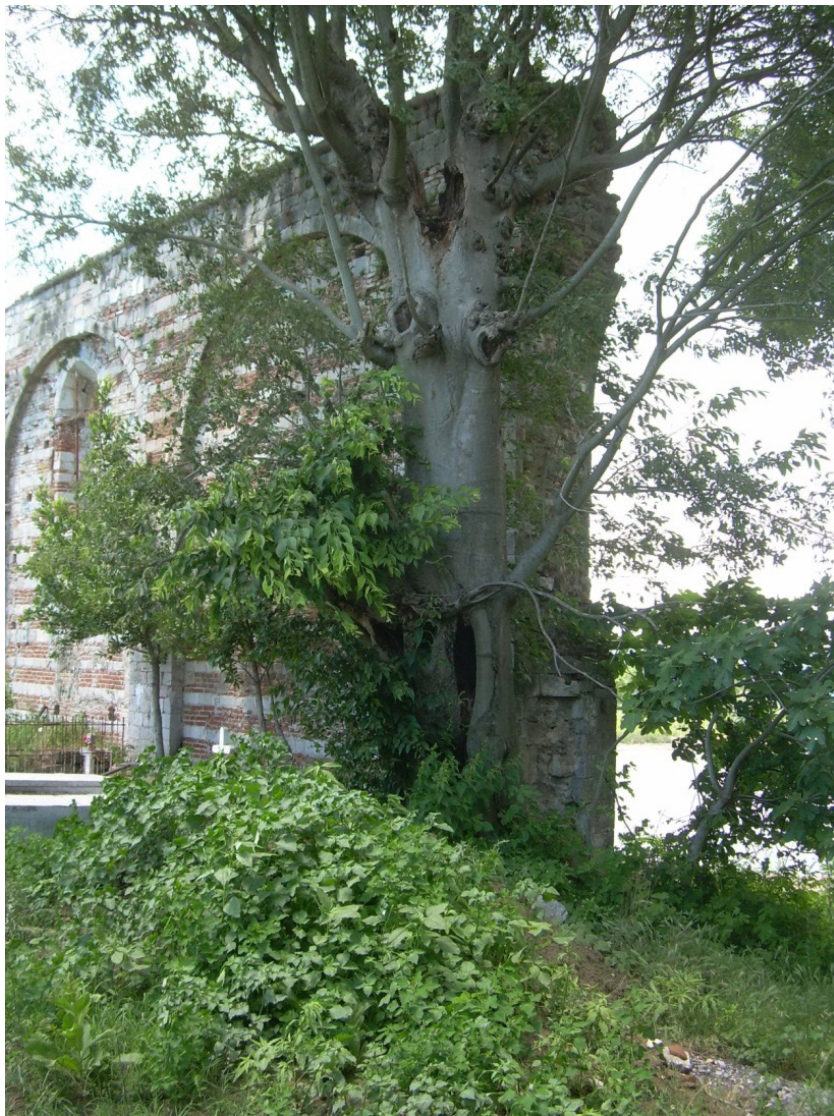
Остао потпорни зид манастира којег је изградила краљица Јелена Балишић

У селу Оботи, на Бојани, била је црква Светога Сергија, већ одавно у рушевинама. У Скадру је 1864. подигнут и храм Св. Александра Невског.