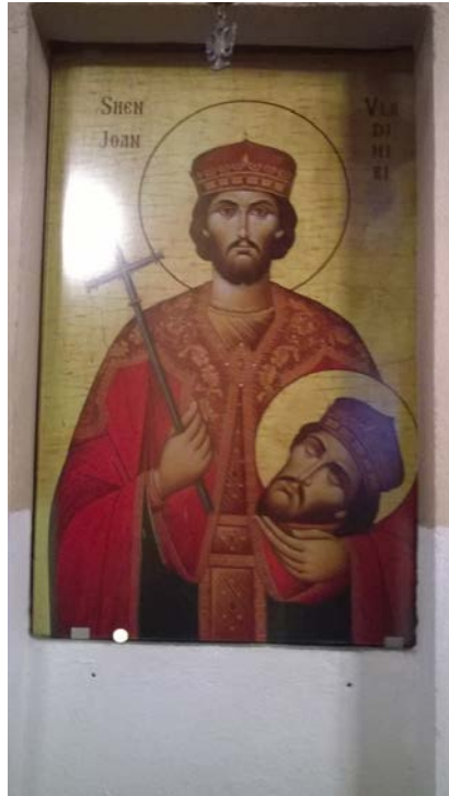
Главна икона светог Јована Владимира у цркви у Елбасану

туђу културу, духовност и уметност, о материјалном богатству да не говоримо.