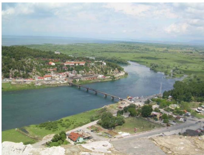
Панорама дела Скадра, десно од моста на Бојани - Веле поље

Прослава васкршњег празника био је леп повод за сусрет са Србима, Црногорцима, који овде не знају за поделе, али и муслиманима и католицима, који знају за своје српско порекло. И потреба да се човек увери још једном у јединствену појаву велике солидарности људи који у генима умеју да носе предачко. Задивљујуће је колико су мотивисани да трагају за коренима, оним прастарим. Били смо изненађени са колико љубави говоре о свом родослову. Они га имају, сачували су га, и поносе се, мада су неки и веру променили! Њихова земља прилично неразвијена, сиромашна, још увек је окована неумољивим традиционалним остацима шеријата. Јер, ипак се зна „где је” жени место, ма ког да је она образовања или порекла.