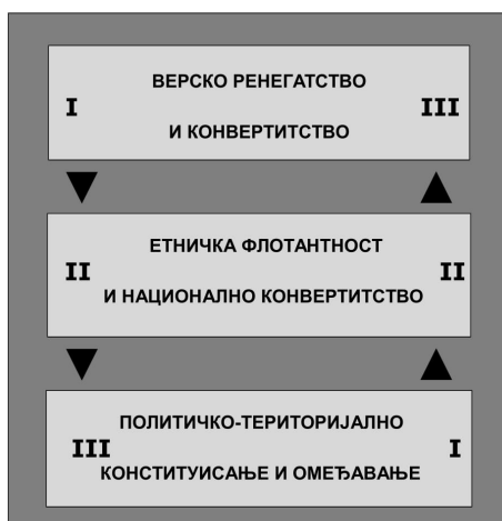
Слика 1: Modus operandi етно-инжењеринга

националног индивидуалитета јесте склоност да даље масовно присилно преобраћају, протерују и физички елиминирају православне Србе, која је много више изражена него код аутентичних Хрвата, Албанаца или Турака. Ипак, процес у неким случајевима може да се заустави на етничкој флотантности и да не досегне ниво новог националног идентитета (на пример: Помаци у Бугарској, Буњевци и Шокци у Србији 1 ). У трећој етапи врши се потпуна или делимична политичко-територијална материјализација и верификација просторних последица настанка нове нације или „трансфера“ из изворне у суседну. При томе, граница државе или јединице нижег ранга може, али не мора да буде успостављена у складу са новим етно-просторним стањем. Њоме се често обухвата већа територија и тако се „резервише“ простор и становништво за настављање „етно-инжењеринга“. О томе сведоче Хрватска и Босна и Херцеговина, у чијим тзв. АВНОЈ-ским границама су се нашле како области већ покатоличених, па кроатизованих, односно исламизованих, па побошњачених Срба, тако и преосталих православних Срба.