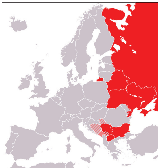
Карта раздвајања Јужних и Источних Словена

Наиме, подсетили би на изјаве грофа Кавура, у то време премијера Краљевства Сардиније и главног геополитичара Запада, који је после Кримског рата (1856), у којем је Русија поражена, радио на формирању нове државе Румуније да се то чини ради „раздвајања Источних и Јужних Словена“. Такође, после пораза Русије од Јапана (рат се водио од 1904. до 1905. године) западне силе, пре свега Аустро-Угарска, користећи се изгубљеним самопоуздањем Петербурга и неспремности војске за нови рат, спречава Србију да избије на Јадранско море и наврат-нанос формирају, после Балканских ратова, нову државу – Албанију.