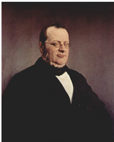
Гроф Камило Бенсо ди Кавур: „Стварамо Румунију да раздвојимо Јужне и Источне Словене“

На жалост, изградња нових народа и нових идентитета се у Србији, између осталог, ради и преко званичних државних институција, невладиног сектора и Универзитета у Новом Саду (пре свега по питању стварања торлачке и шопске нације). Такође, Румунија и западни савезници ове државе граде идентитет Влаха као румунски и антисрпски. Оно што је интересантно са аспекта геополитике и будућности православних Словена је одсуство проучавања Румуна и Румуније, као и њихове улоге у раздвајању Источних и Јужних Словена.