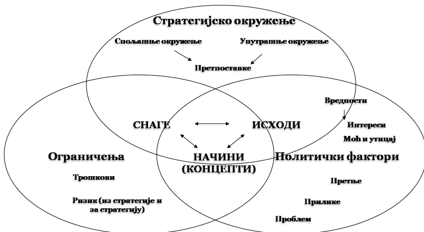
Слика 1: Логика развоја стратегије

најважнији и суштински део стратегије (слика 1). Оптимална стратегија увек се састоји од исхода, концепата и снага, а фокус је на томе како они синергијски комуницирају са стратешким окружењем да би се добили жељени ефекти (Vračar i Milkovski 2022, 52–56).