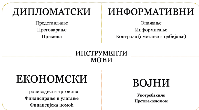
Слика 3: Инструменти националне моћи