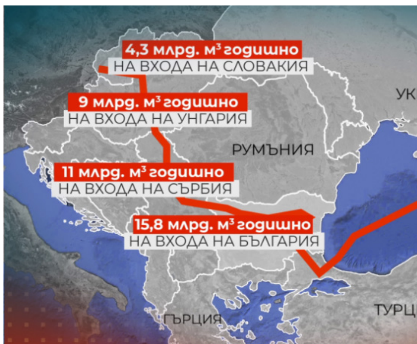
Слика 2. Гасовод Балкански ток