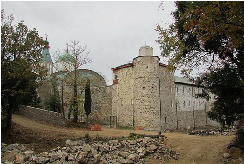
Манастир Стари Русик (Свети Пантелејмон)

Душанов пример следили су и потоњи српски владари. Тако су краљ Вукашин и његов брат деспот Угљеша 1366. године потврдили Русику село Копривљане. 13 Браћа Јован и Костадин Драгаш 1377-78. године обдарили су манастир новим поседима око Струмице, Штипа, Тиквеша, Брегалнице и Злетова. Кнез Лазар му је 1381. године даривао властелинство „Св. Спаса“ у старом Хвосну - данашњој Метохији и властелинство „Мати Божје Бучанске“ код Трстеника, а његов зет Муса са синовима Стефаном и Лазаром са пет села у области Лаба. 14