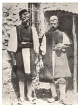
Слика 17. и 18. Бугарски сточари на Деспотским планинама 19. Власи-Цинцари