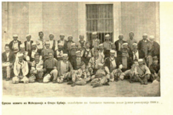
Српски четници из Македоније и Стари Србији, окупирани од Османлија, познати по својој државној реконструкцији 1904 г.