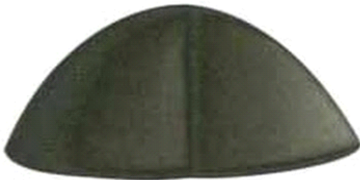
Слика 14. Монашка капа ћелепуш или ћелемпош

ЋЕЛЕПУШ - ћелепуш или ћелемпош је назив за црну монашку капу која је истог облика као и ова бела капица. У основи ове речи је “ћела” односно глава, теме лобање.