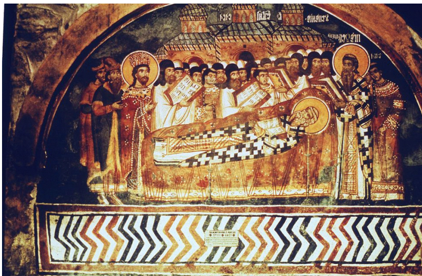
Слика 9. Сахрана Архиепископа Саве 2. у Цркви Св. Апостола у Пећкој Патријаршији

„У старија времена, данашња традиционална албанска, је била српска народна ношња. Иван Јастребов је записао да је ношња Фанда тј. уопште Дукађинаца, готово сасвим иста као ношња Маћана, Шаљана и Црногораца... уске гаће, беле капице... то је чисто српска одећа из старих времена. У такву ношњу је била одевена цела српска војска када је против побуњене Србије кренуо цар Манојло (према сведочењу Кинама којег цитира Панта Срећковић). Кинам је записао: Приближивши се реци Тари, пре сунчаног заласка, византијска војска увиде безбројну множину наоружаних Срба... Одело им је било: доламе, уске гаће и беле капе...“