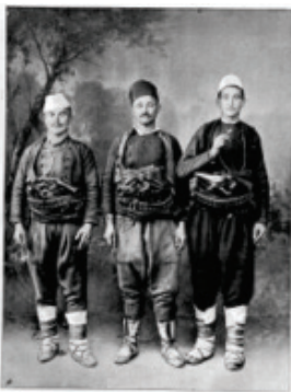
Тито Бугарин из јаворј. Арма из Српских Ризница.