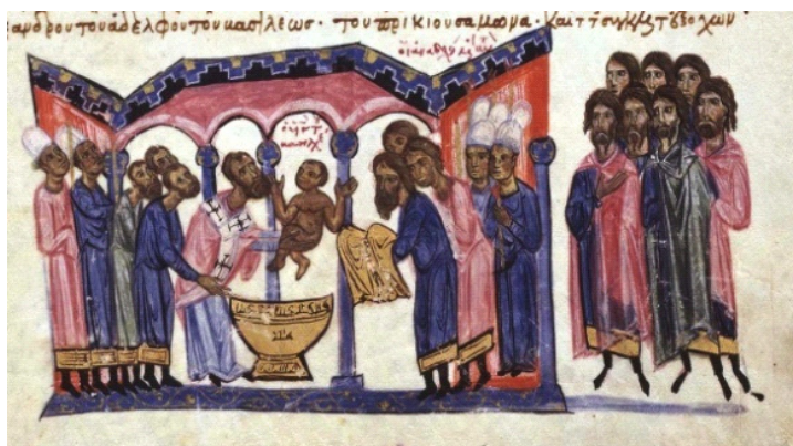
Слика 6. Крштење Порфирогенита

Следеће фотографије су из грчких црквених књига и представљају животопис ромејског цара Константина 7. Порфирогенита. На тим цртежима и украсима могу се видети свештеници и цивили са белим капама налик кечету.