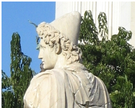
Слика 10. и 11.- Пилеус на цртежу грчке вазне и на кипу.