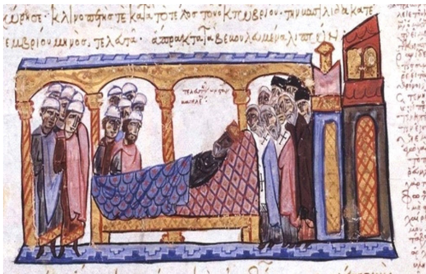
Слика 8. Смрт Порфирогенита

Иако имамо овакве доказе за постојање кечета код Православаца, то код Словена, а поготову код Срба не умањује презир и незнање о овој нашој капи која је свуда распрострањена. Зато посебну пажњу Срби треба да обратe на фреске и иконе из Пећке Патријаршије на Косову и Метохији.