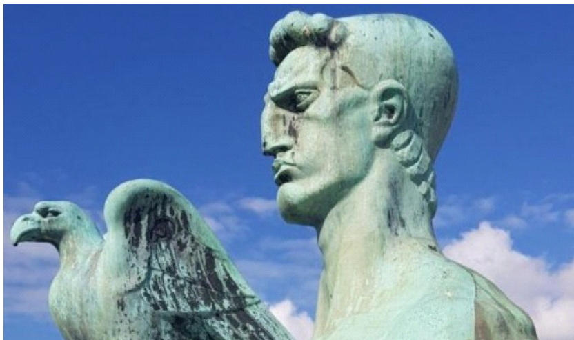
Слика 23. Победник

У последње време друштвене мреже су пуне чуђења и лоших мисли о Мештровићевом Победнику на Калемегдану. Мештровић је био хрватски уметник и вајар који је добро познавао историју народа и то је овековечио у својим радовима. Два најзанимљивија вајарска рада која имају приказ кечета су Победник на Калемегдану и заборављени српски косовски јунак Срђа Злопоглеђа.