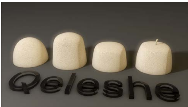
Слика 22. Разне врсте и облици кече-капа