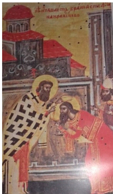
Слика 4. Православна икона Слика 5. Крунисање Стефана Дечанског

Следеће фотографије су из грчких црквених књига и представљају животопис ромејског цара Константина 7. Порфирогенита. На тим цртежима и украсима могу се видети свештеници и цивили са белим капама налик кечету.