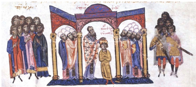
Слика 7. Крунисање Порфирогенита 908. године