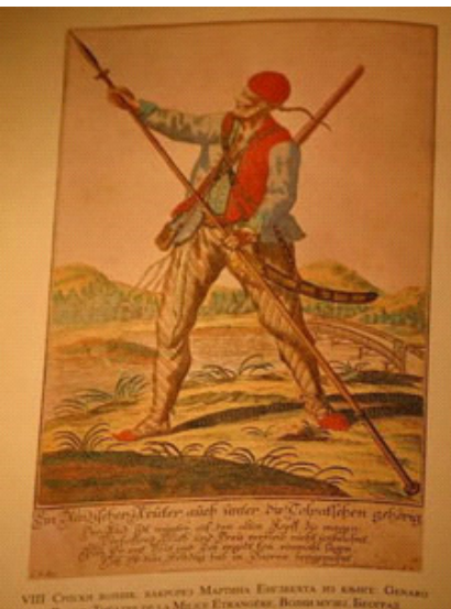
Слика 12. Униформа српског војника, Војни музеј Слика 13. Српски војник, Крајишник

ЋЕЛЕПУШ - ћелепуш или ћелемпош је назив за црну монашку капу која је истог облика као и ова бела капица. У основи ове речи је “ћела” односно глава, теме лобање.