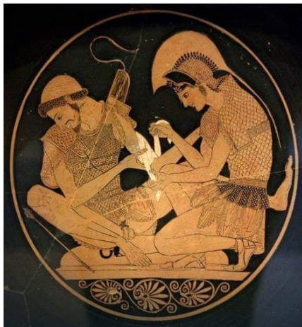
Слика 1. Птоломеј Слика 2. Патрокло вида ране Ахилу 500. г.п.н.е.

Да кече није био део ношње Албанаца (као ни цела ношња) говоре многе иконе и фреске, антички споменици Илира, Трачана, Хелена... као и историјски подаци и чињенице да Албанци нису Балкански народ и да са старим народима, а и садашњим суседима немају заједничких тачака и особина. Предео данашње Албаније се некада звао Епир, Срби су га тако називали до 16. века. Албанци су у тај предео насељени 1042. године током војног похода. Наиме, Ромеји су се у то време сукобили са Србима и у више наврата су губили битке, што је проузроковало грађанске немире по Ромејском царству. „Један од побуњеника био је Ђорђе Манијак, који је командовао византијском војском на Сицилији и јужној Италији. Пошто су га без разлога сменили одлучио се на побуну и кренуо да узме власт у Цариграду. Са собом је као помоћне трупе повео Албанце са Сицилије, па се искрцао преко Драча и код места Острово сукобио са ромејском војском и на том месту погинуо. Албанце који су се предали су протерали су на српске земље, и ту су остали до данашњег дана. Од тог догађаја пролазиле су године и долазили су нови господари којима су Албанци били врло одани, а за своју оданост су добијали нове земље на штету Срба, тако да су се временом проширили и пресељавали на Косово и Метохију, Македонију, Пчињску и Топличку област,