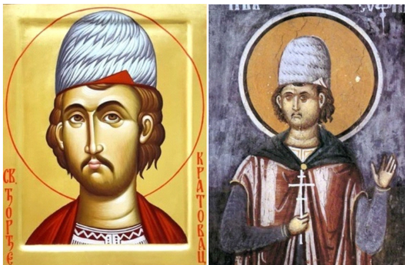
Слика 3. и 4. Свети српски мученик Ђорђе Кратовац