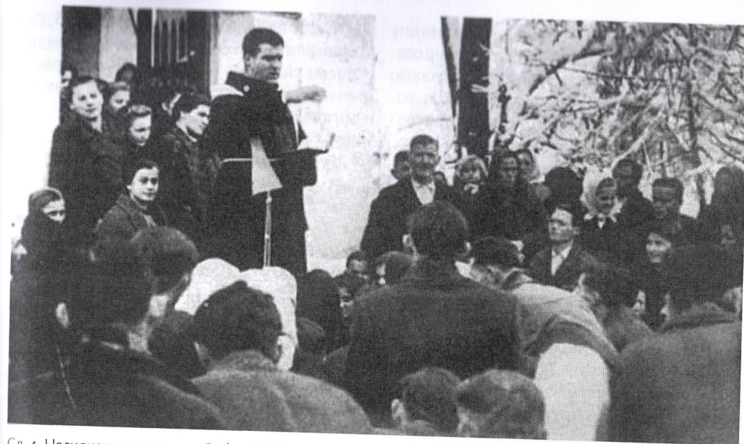
Сл. 4: Насилно покрштавање Срба у НДХ

Следеће питање које се отвара, а везано је претходним питањем, јесте зашто се догађа крађа православне (српске, односно) руске културе. Наиме, јавна је (научна) тајна да су римокатолици, Хрвати покушали да од Срба преотму поред језика и културно наслеђе. 28 Одговор се крије у тајни броја поунијаћених Срба који су претопљени у Хрвате. Ако је вероватни статистици онда је то већина Хрвата. 29 Када су римокатолици Хрвати, званично прогласили српски језик као свој, покушали су да узму и културно наслеђе, без обзира на његову отворену православну основу. 30 Тако се у хрватској књижевности могу пратити присвајања Немањића, Обилића, ускочке књижевности, народних песама, а у новије време Ине