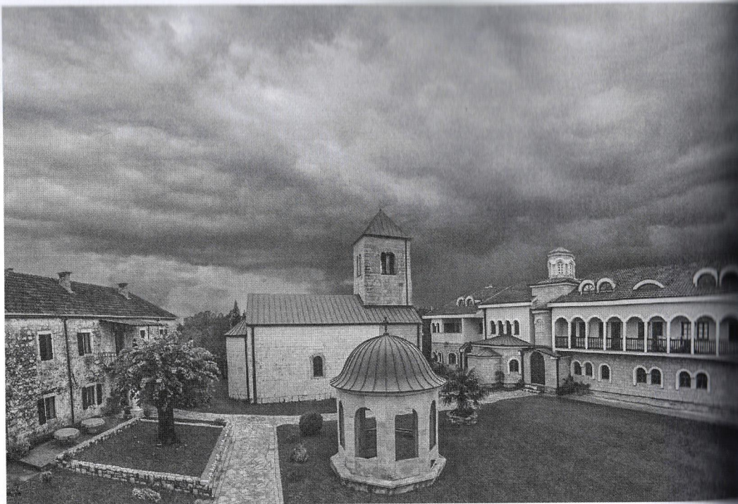
Сл. 6: Манастир Ждребаоник

оборили досадашње тврђење да је Свети Сава спаљен, и свакоме расветлили да је његово тело међу његовом паством, у светој старој задужбини његова брата, у манастиру Ждребаонику.