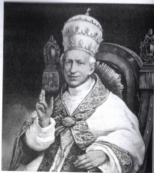
Сл 2: Папа Лав XIII (1810–1903)

Осим тога за Србе је постављена нова замка у Босни и Херцеговини. Папа је желео да се у складу са новом унијатском политиком на Балкану створи нова црквена организација у Босни и Херцеговини коју је 1878. године окупирала Аустро-Угарска Монархија. Да би план функционисао требало је нову надбискупију, тј. нову црквену организацију у БиХ потчинити Загребу, тј. Хрватима. У том се духу залагао и Штросмајер који је сматрао да „нова црквена организација треба да буде у функцији оснаживања хрватско-славонске црквене покрајине чији је Загреб центар јединствена и снаге и коме би морала припадати читава црква Јужних Славена“. 14 У то време још се није постојала Велика Хрватска и