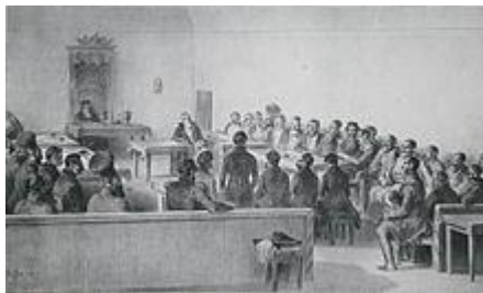
Законодавна скупштина Влашке, 1837. године

Почетак 19. века обележавају нови преокрети и револуције, како против Османске империје, тако и унутар саме Влашке. Углавном, Османска империја ликвидира фанариотску владу Влашке, али новог кнеза, Григорија IV Гика свргавају Руси током Руско-турског рата (1828–1829).