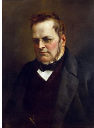
Слика: Антонио Сисера, Камило Бенцо ди Кавур. XIX век. Премијер Краљевства Сардиније и један од реализатора идеје раздвајања Источних и Јужних Словена

Подсетили би да је Румунија већ манифестовала наведене тежње, за сада активно према Молдавији и Србији, а пасивно према целом Балкану и Украјини. Да подсетимо да је Румунски парламент 8. маја 2013. године , већински усвојио „законодавни амандман”, проглашавајући „Румунима” све романске народе и етничке групе које живе у земљама Балкана. Како преноси румунско издање Romanian Global News -а, одлука је подржана од стране свих парламентарних фракција, без обзира на негативне коментаре о нацрту закона Министарства иностраних послова Румуније.