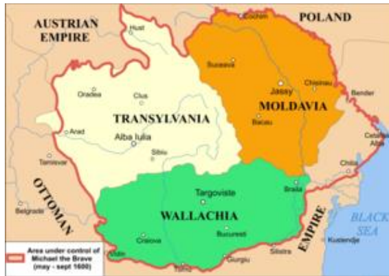
Влашка (зелена боја) крајем XVI века

Период нестабилности продужио се све до владавине Радослава (Радула) IV, који је успео да постигне компромис са локаном елитом, што је значило и да се Влашка потчињава Османској империји, у најблажој могућој форми, плаћањем годишњег данка (1525).