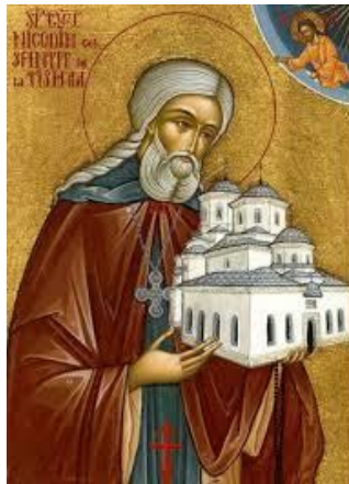
Свети Никодим Тисмански, оснивач влашке духовности

Осим реченог, Свети Никодим ослободио је Влашку од ромејског клерикализма и саградио у њој манастире Водицу, Тисману и Прислоп.