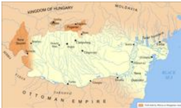
Влашка за време владавине Мирче Старог

Крајем 14. века војска Османске империје излази на Дунав и почиње да упада у Влашку. Борбе трају са промењивом предношћу, те је Мирча Стари склопио мировни споразум са Османлијама, предавши два важна града. Ови градови остају делом Османске империје све до 1829. године.