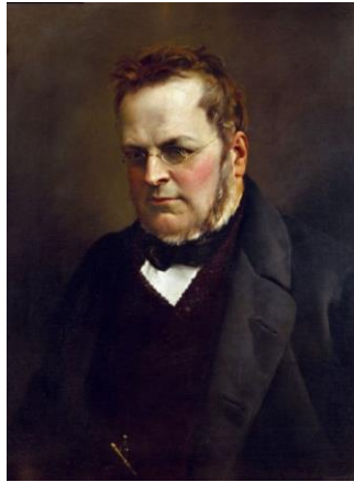
Слика: Антонио Сисера, Камило Бенцо ди Кавур. XIX век. Премијер Краљевства Сардиније и један од реализатора идеје раздвајања Источних и Јужних Словена

Подсетили би да је Румунија већ манифестовала наведене тежње, за сада активно према Молдавији и Србији, а пасивно према целом Балкану и Украјини. Да подсетимо да је Румунски парламент 8. маја 2013. године , већински усвојио „законодавни амандман”, проглашавајући „Румунима” све романске народе и етничке групе које живе у земљама Балкана. Како преноси румунско издање Romanian Global News -а, одлука је подржана од стране свих парламентарних фракција, без обзира на негативне коментаре о нацрту закона Министарства иностраних послова Румуније.