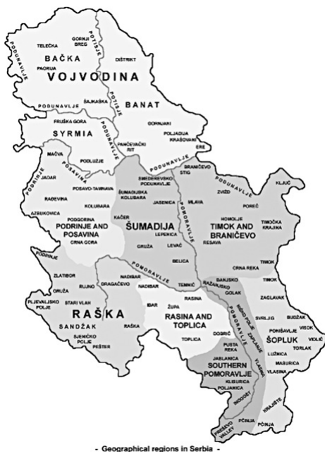
Карта 1. Србија без Косова и Метохије у Зборнику радова Православље и идентитетниј њ православних народа, објављеном 2019.