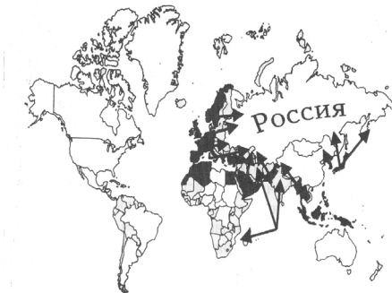
Слика 2 – „Стратегија анаконде”: на слици су црном бојом обележене земље евроазијског континента под стратешком контролом атлантизма, где стрелице показују векторе геополитичког притиска

Предлог за решавање геополитичких проблема и у циљу остваривања америчких националних интереса Мехен је формулисао у виду тзв. „стратегије анаконде“. 18 (Види слику 2). Наиме, он ја закључио да би копнене масе Евроазије требало стезати у прстенима „анаконде“, где је основни спољнополитички циљ било међусобно повезивање приобалног појаса, који је играо кључну улогу у доминацији светом, после чега би уследило његово проширивање.