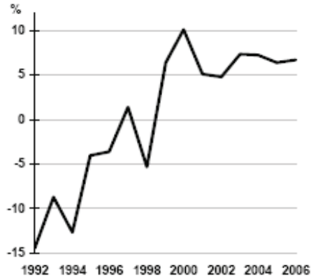
Графикон 2. Раст руске привреде

Први и најважнији економски тренд 2007. и 2008. године био је наставак политичке и економске стабилности. То је омогућило поуздане прогнозе привредних кретања, па је привукло бројне стране инвеститоре. Ови процеси су подстакли и руске привреднике да повећају домаће инвестиције уместо да средства пласирају на иностраним тржиштима као до сада. То је готово аутоматски довело до отварања нових радних места и подстакло изузетан привредни раст који је 2007 и 2008. године износио читавих 8%. Најзад, дошло је и до побољшања животног стандарда руског народа. Још један позитиван кључни тренд 2007. и 2008. је константно повећање цена нафте, чије су се последице осетиле у читавој руској привреди. Повећање светске цене сирове нафте је донело стаалан прилив девиза у Русију, с обзиром да нафта чини 34,5% руског извоза.