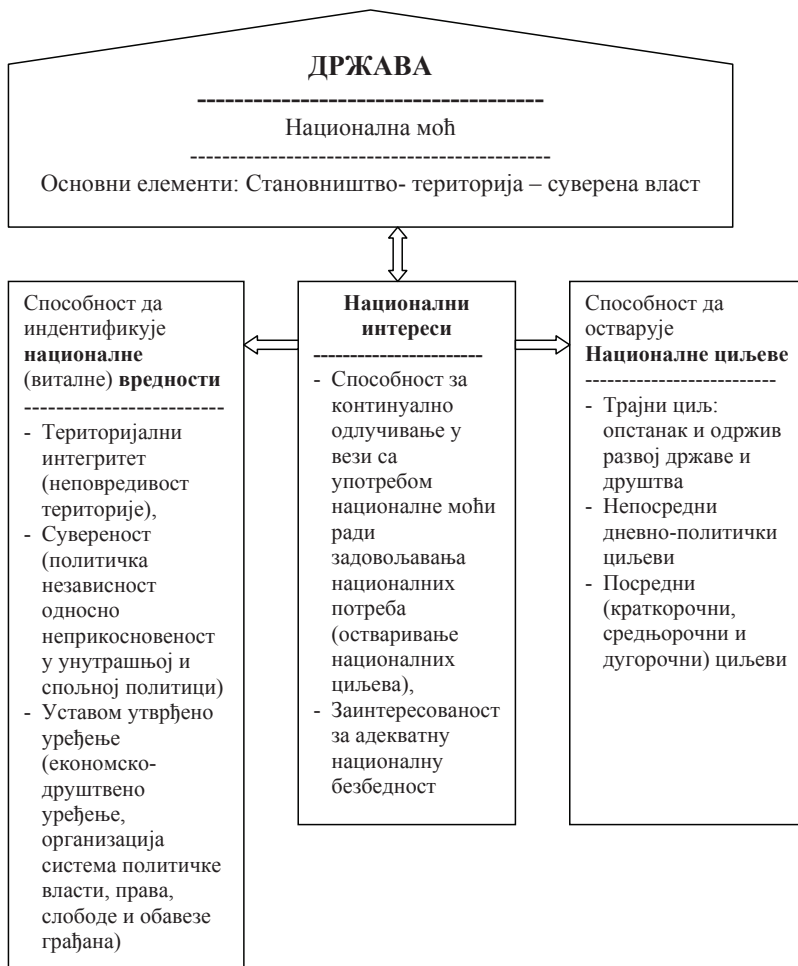
Слика 1. Структура националне моћи