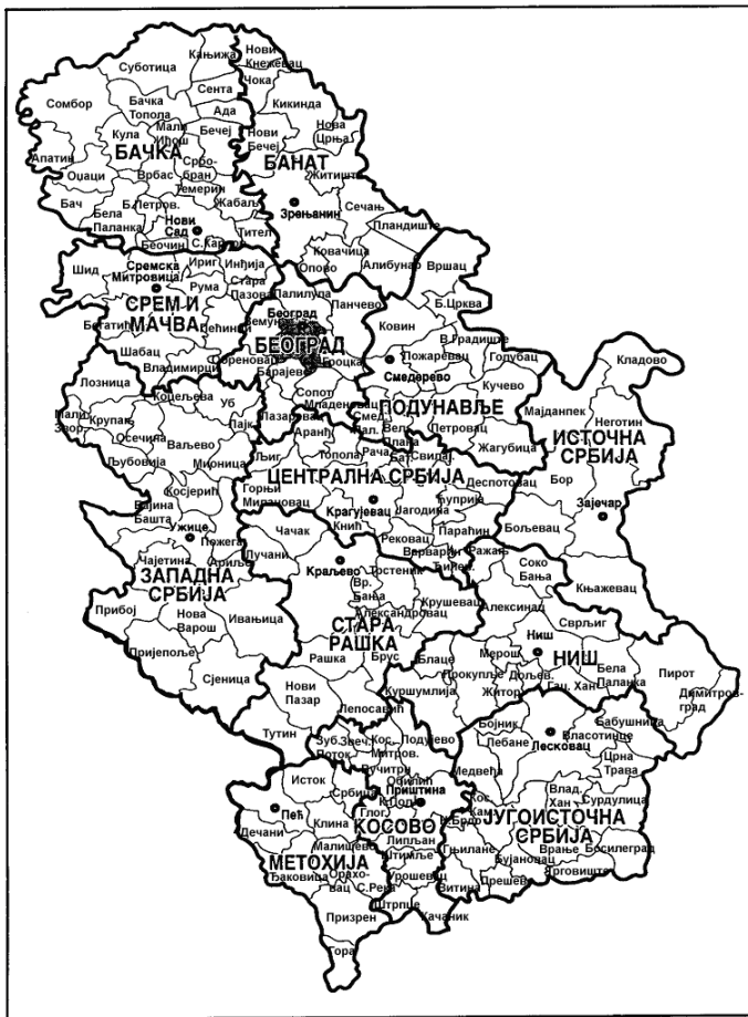
Карта 2: Региони као политичко-територијалне јединице у регионалној држави Србији (предлог М. Степића)