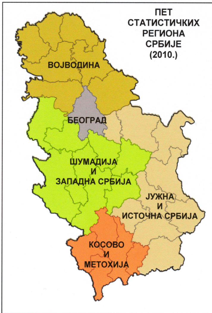
Карта 1: Територијализација пет статистичких региона Србије

Извор: http://en.wikipedia.org/wiki/Statistical_regions_of_Serbia (карту је називима региона допунио М. Стенић)