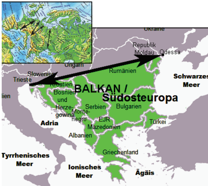
Карта 1: Балканско полуострво – полуострво или не?

Одређење појма Балканско полуострво проистиче углавном физичко-географског просторног поимања. И док су међе дуж морских акваторија које га окружују мање-више неспорне (изузимајући припадност неких егејских острва), северна полуострвска тзв. природна граница дискутабилна је са две тачке гледишта: