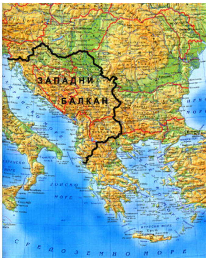
Карта 4: „3/Западни Балкан“ у време формирања

У документима ЕУ експлицитно се наводило да су у саставу „3/Западног Балкана“ следеће државе: Хрватска, Босна и Херцеговина, Албанија, БЈР Македонија и (тадашња) СР Југославија. Сходно томе, површина „3/Западног Балкана“ износила је 264.301 км 2 , што је 1/3 Балкана у традиционалним геополитичким границама. Иако су функционери ЕУ најчешће говорили да се ради искључиво о техничкој, прелазној и пролазној творевини неутралног назива, бројни званични закључци, планови и пројекти ЕУ су то оповргавали. Било је очигледно да постоји стратегијски приступ „центра“ („Империје“) према „периферији“, којој је намењен дугогодишњи статус „карантина“ за њена сукобљена „племена“ како