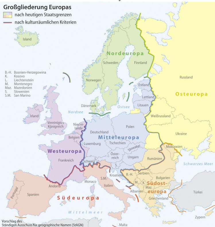
Карта 5: Mitteleurop-ски „културни простор“ као немачка интересна сфера са преобликованим делом Балкана у њеном саставу

немачка интересна сфера, заоденута привидно бенигним плаштом интегрисања централноевропског културног ареала, тако би се готово комплетирала. Геокултурна, геоекономска и геополитичка, а у блиској будућности и геостратегијска „завеса“ Немачке и њених сателита практично би се спустила од Балтика до Јадрана. За решавање остала би још нека, већ проблематизована питања несагласности граница пројектоване интересне сфере (у облику културног простора) и постојећих државних граница – западна, поунијаћена Украјина, румунске панонске области и Трансилванија, те српска Војводина. (карта 5) Љубљану, главног немачког експонента на постмодерном, транзиционом европском „Југоистоку“, после 2013. године замениће неупоредиво великодржавно амбициознији Загреб.