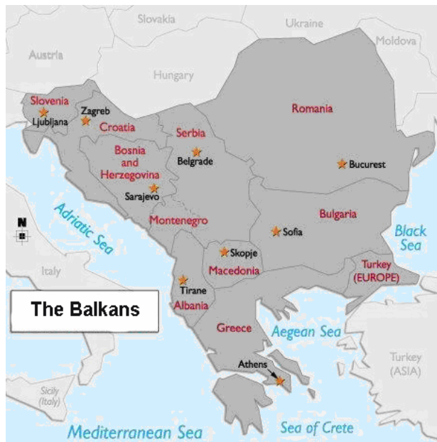
Карта 2: Балканско полуострво и Балкан

Балканско полуострво је првенствено физичко-географски појам, а граница на Сави и Дунаву представља више историјско-цивилизацијски реликат – један од многих у Европи. Површина Балканског полуострва је 520.000 км 2 и