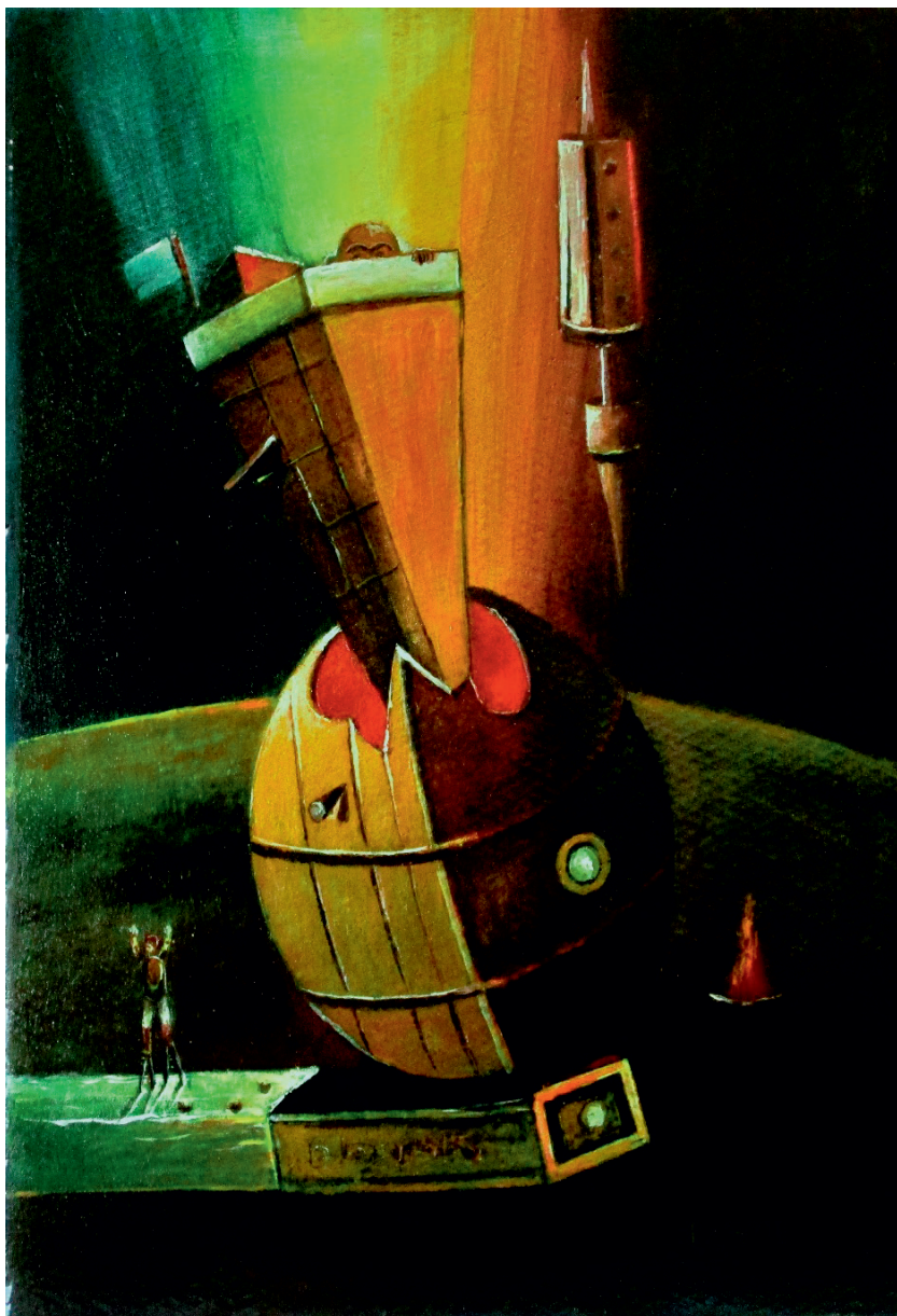
Прво лансирање из Бауре.