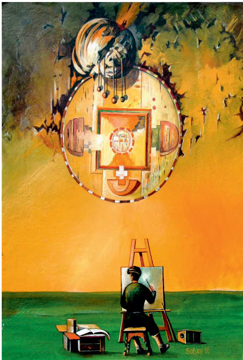
Уклети сликар, 2010.