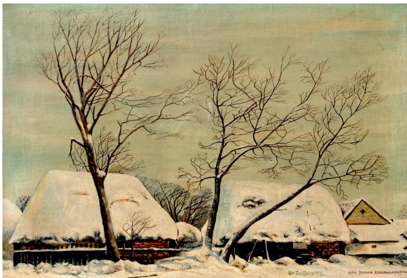
Дан Јелене сто двадесет трећи, 1978.