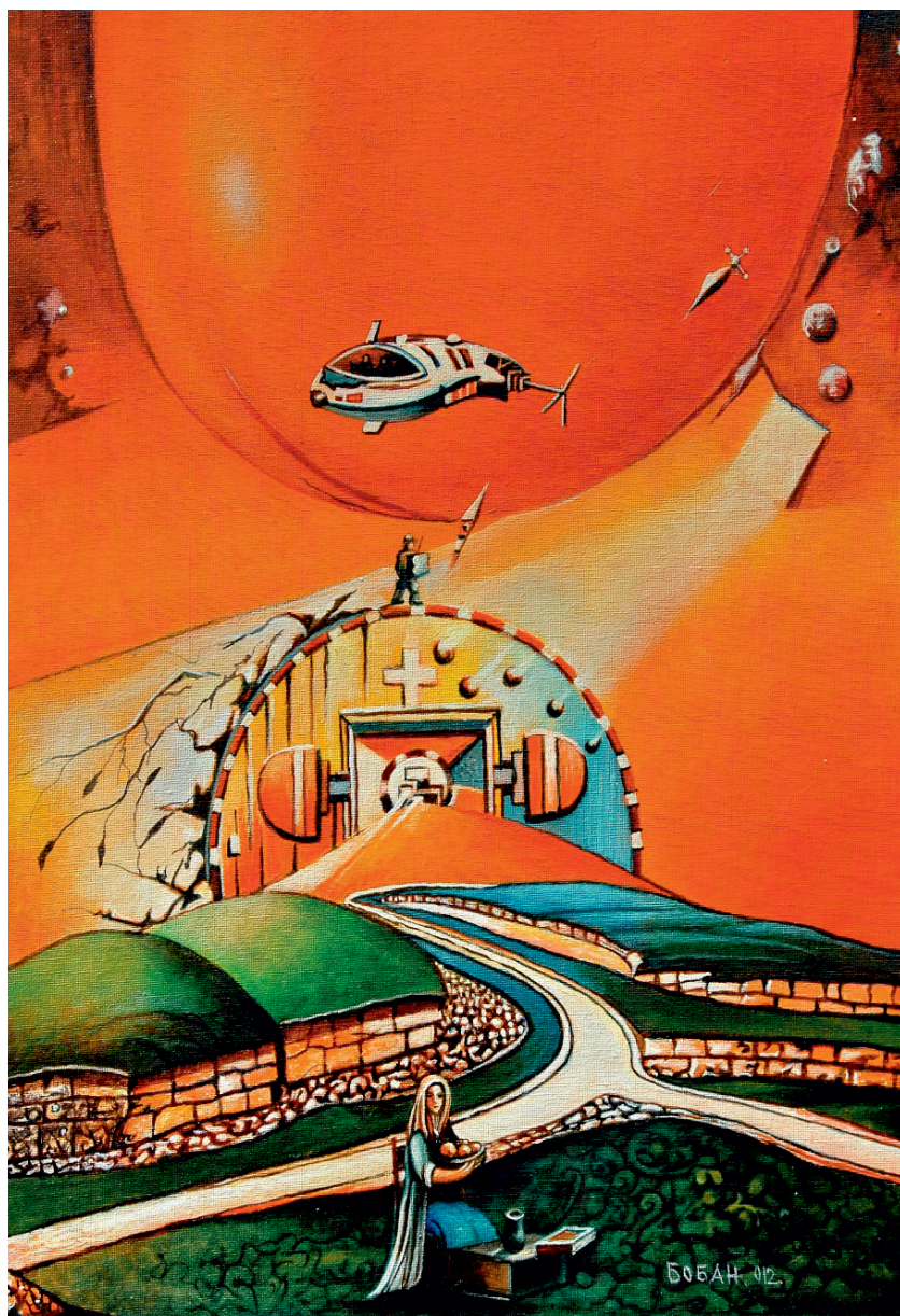
Чекајући кћи Јелену, 2012.