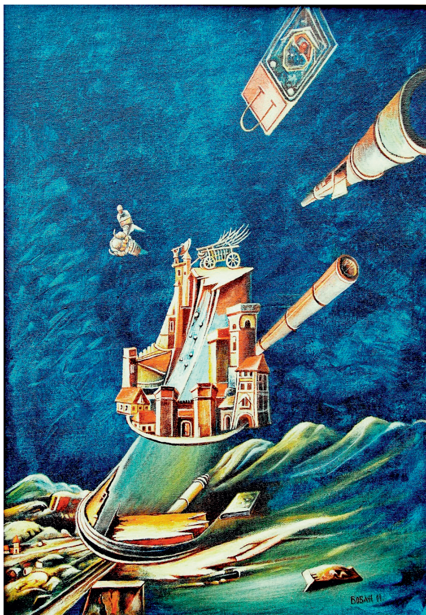
Зидање куле Николе Тесле, 2011.