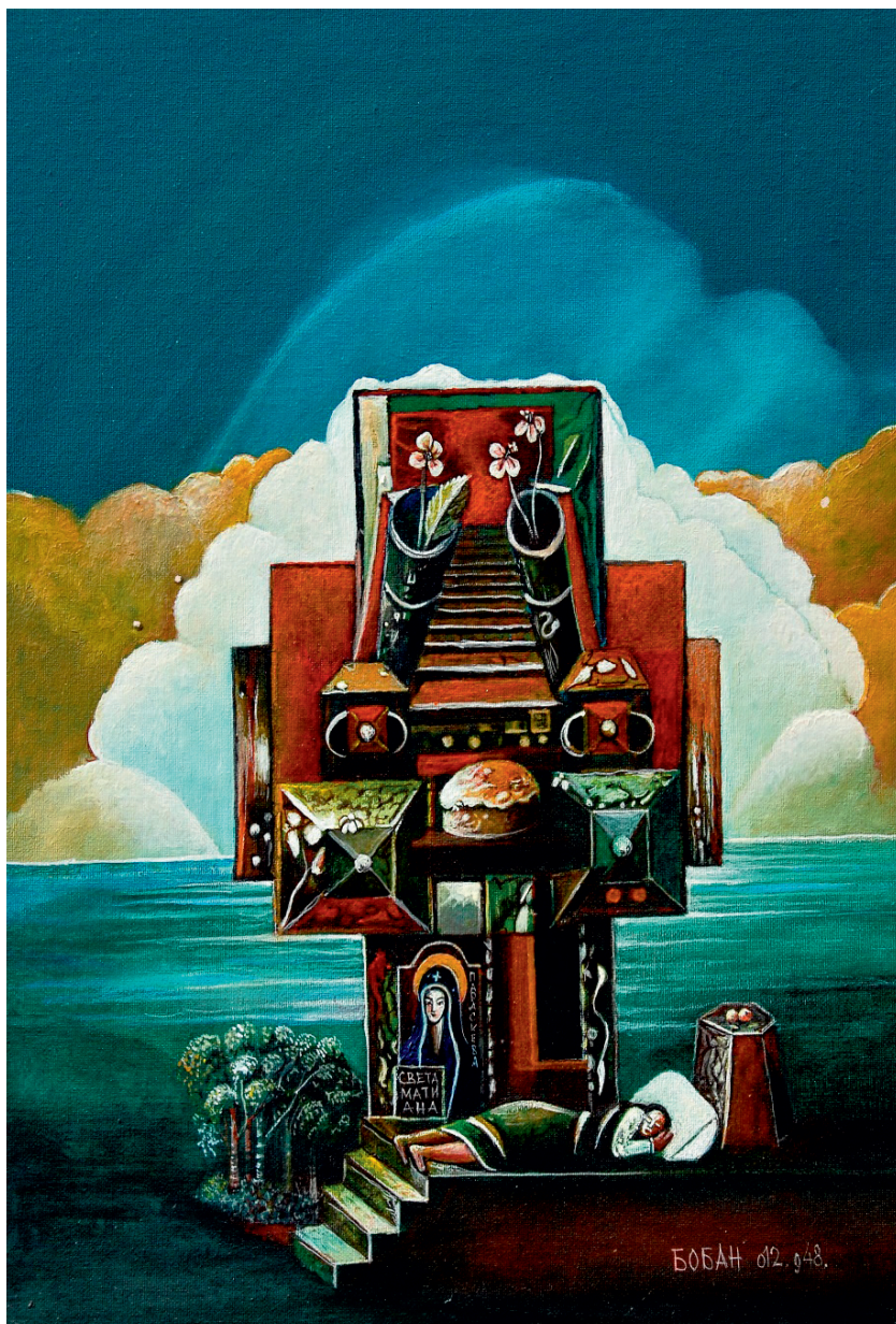
Света Мати Ана, 2012.