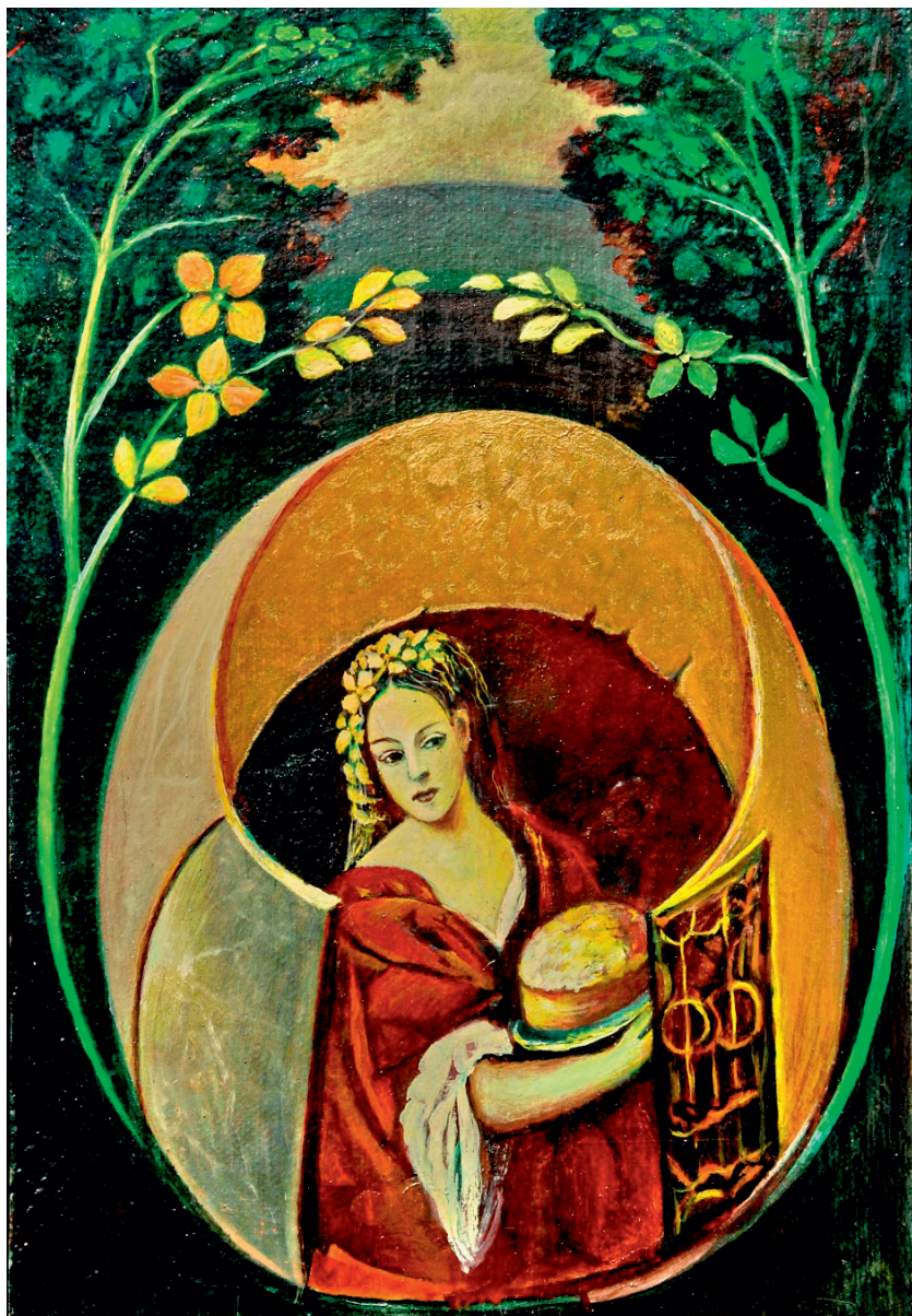
Лепотица и хлеб.