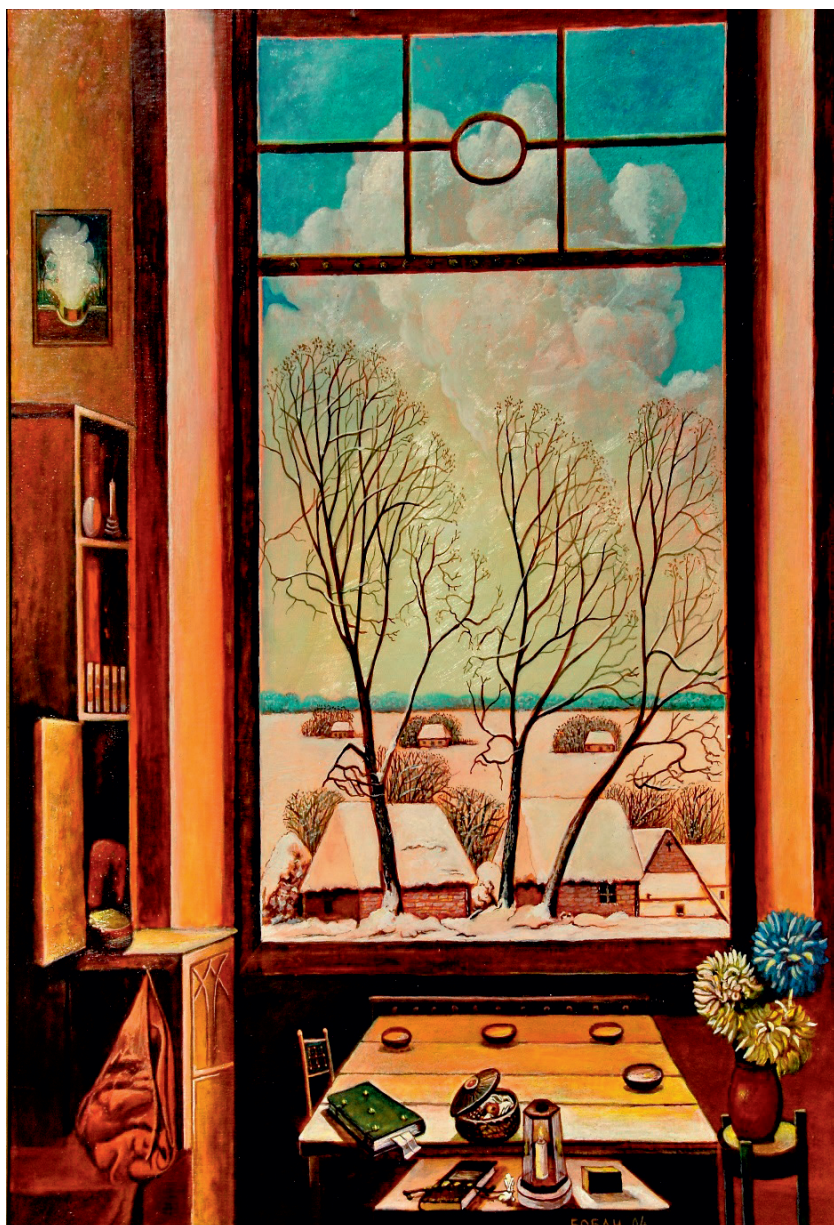
Зимски дан на дар, 2004.