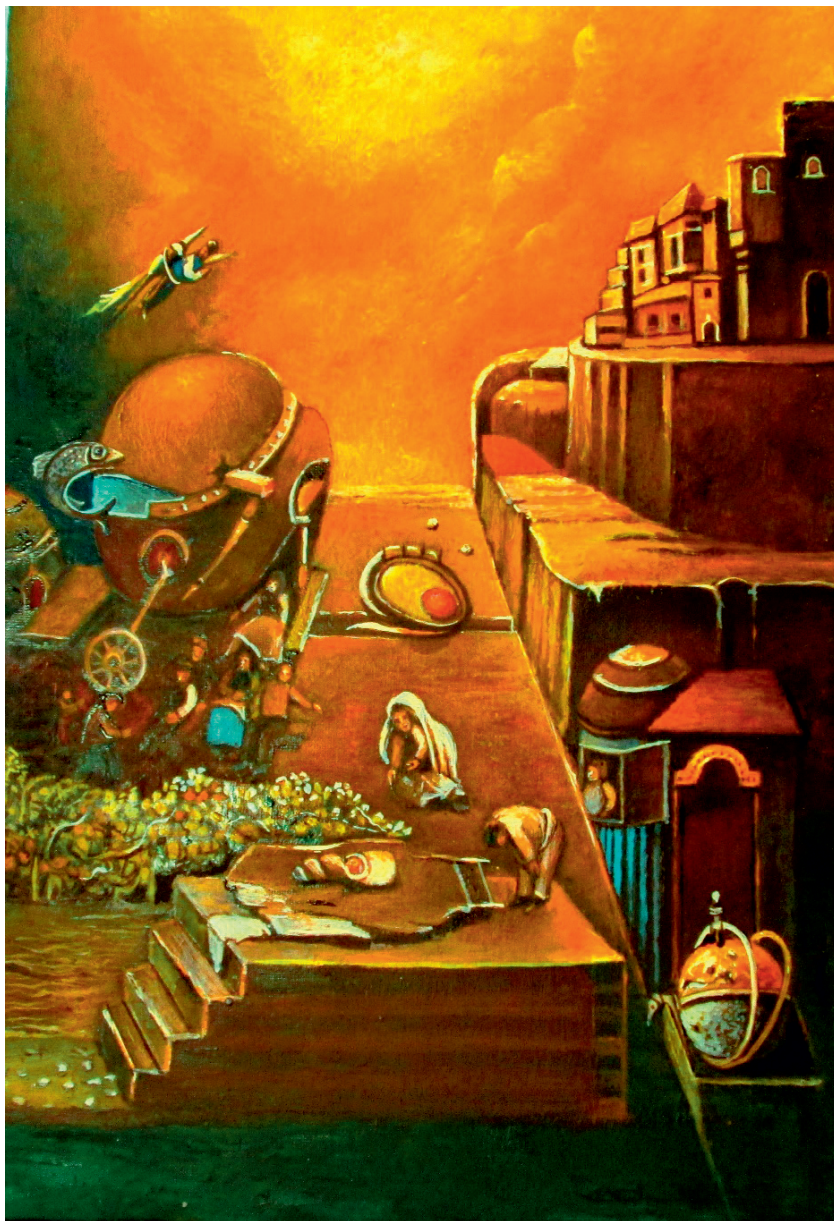
Дошао сам, ипак.