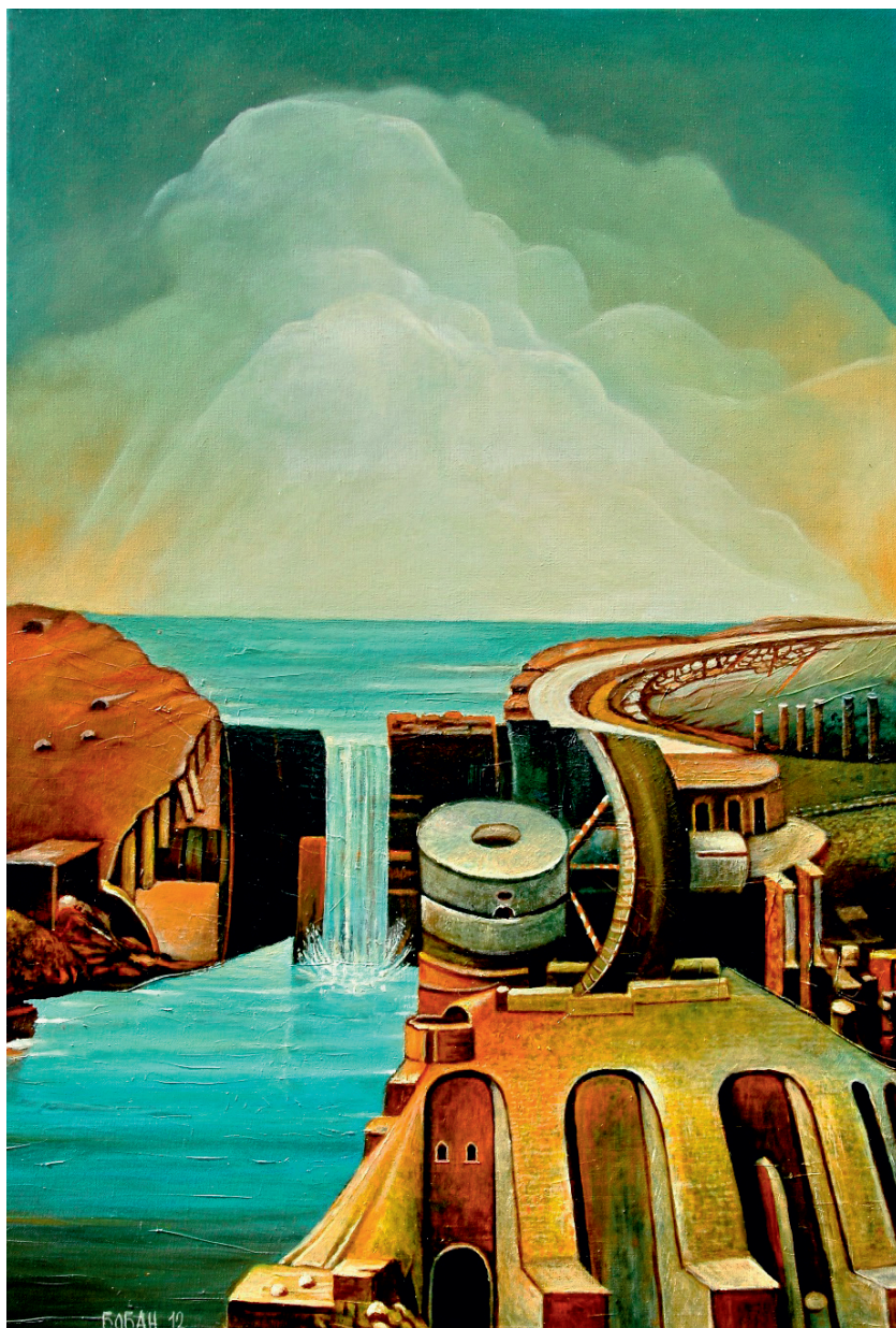
Све се мења, и камен, 2012.