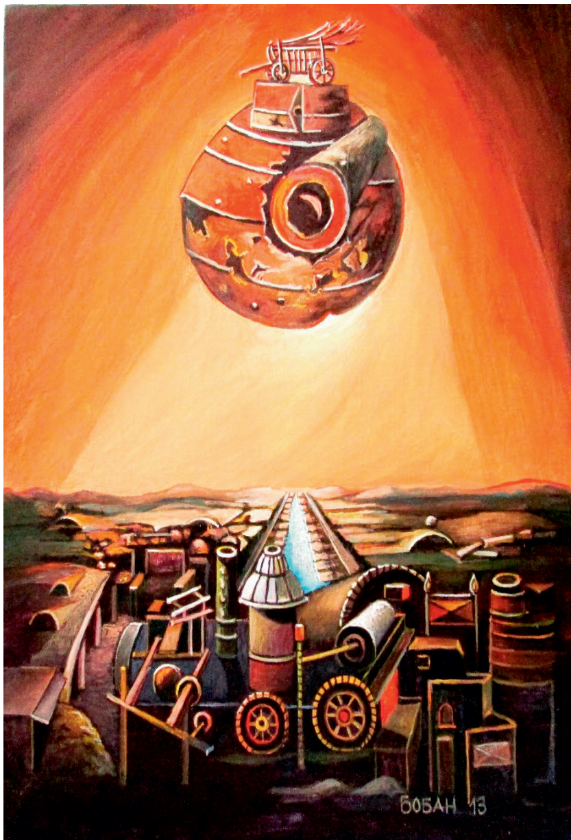
Бобанов сан, 2013.