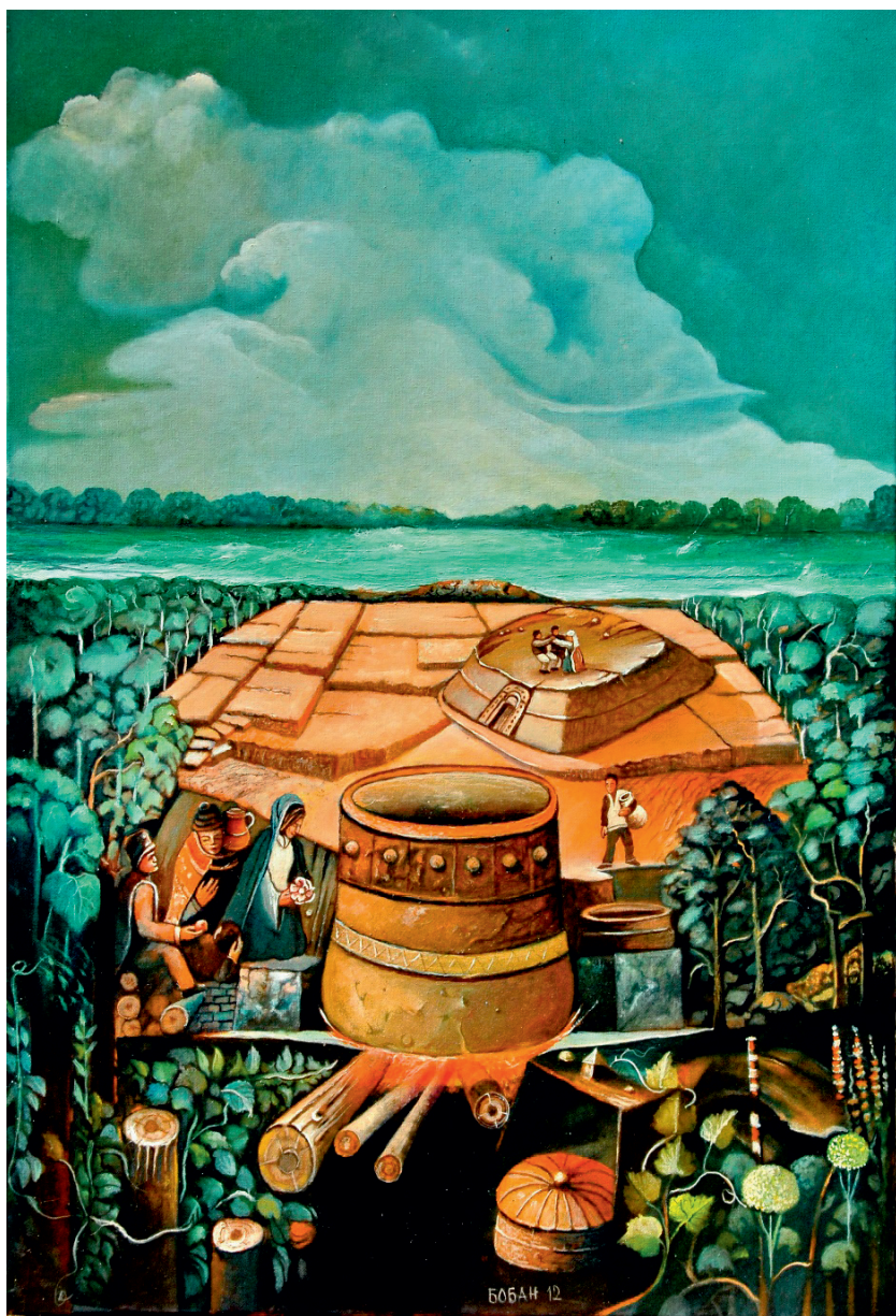
Тајни напитаk, 2012.