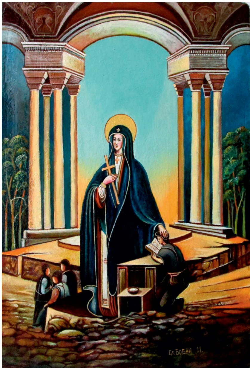
Сан Славков, Требиње, 2011.