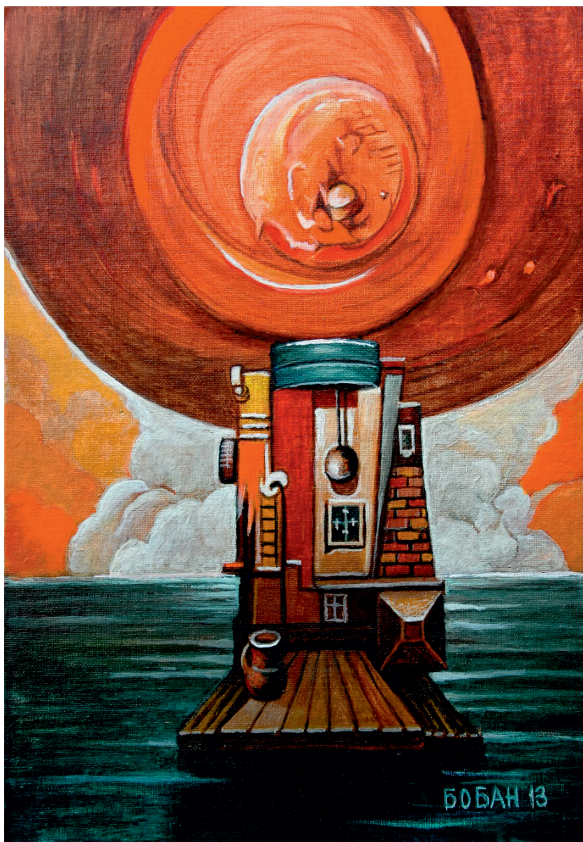
Време садашње, 2013.