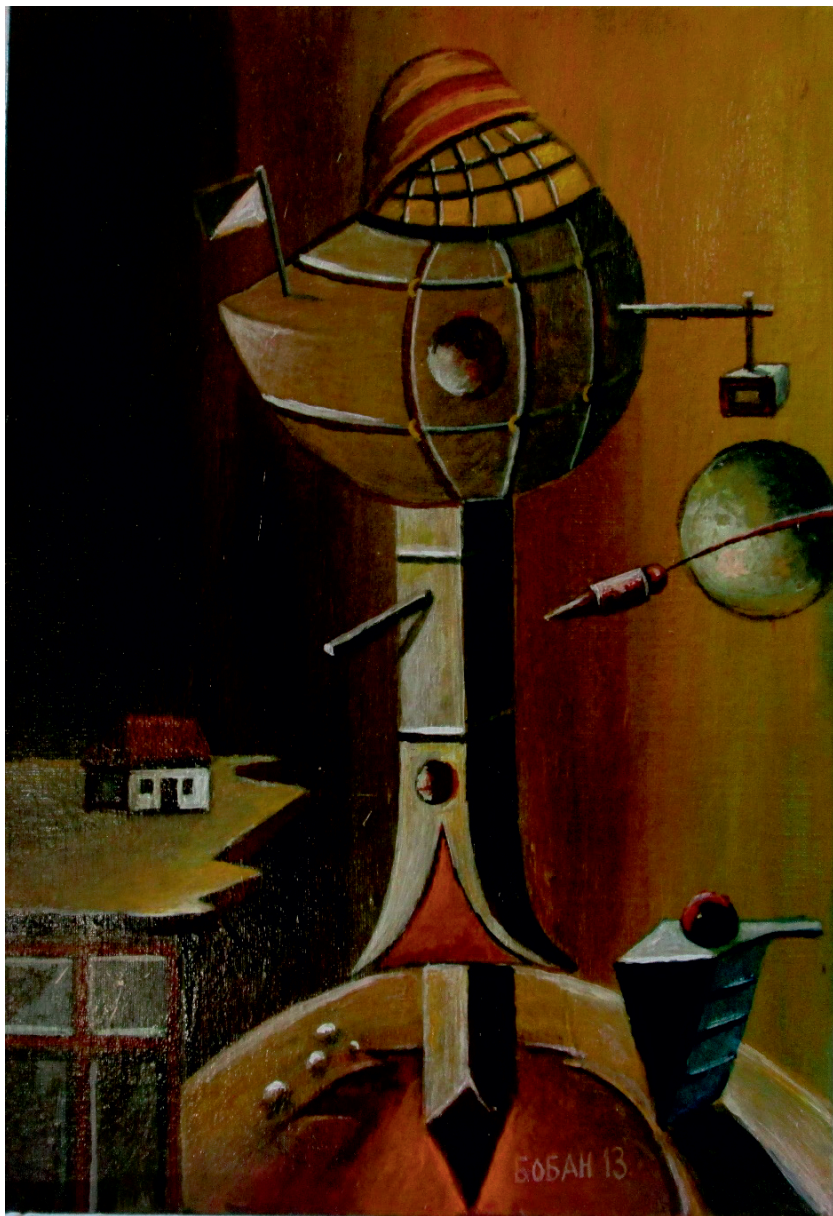
Дочек повратника, 2013.