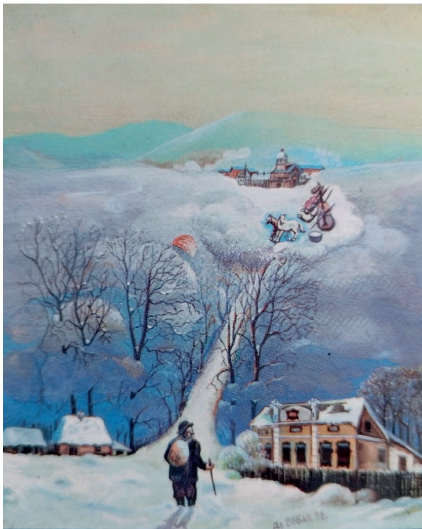
У Шабац по цицвариће, 1998.