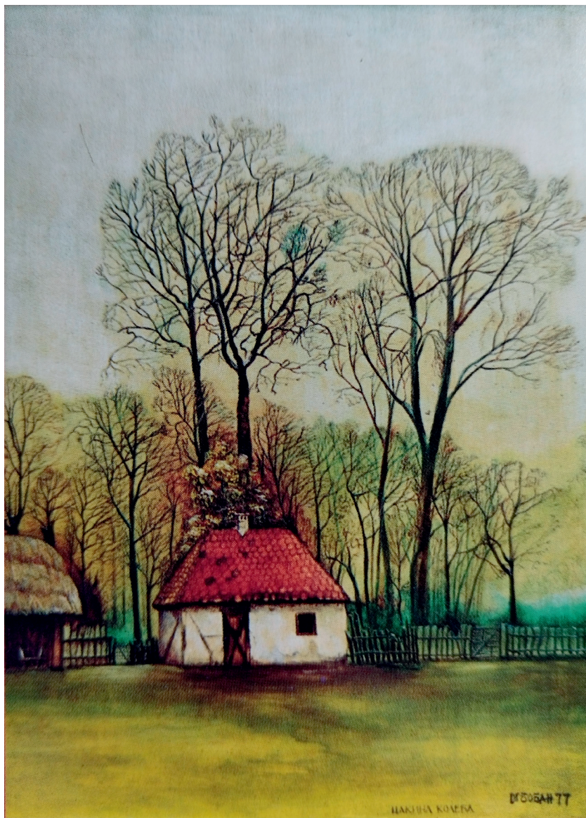
Цакина колеба, 1977.