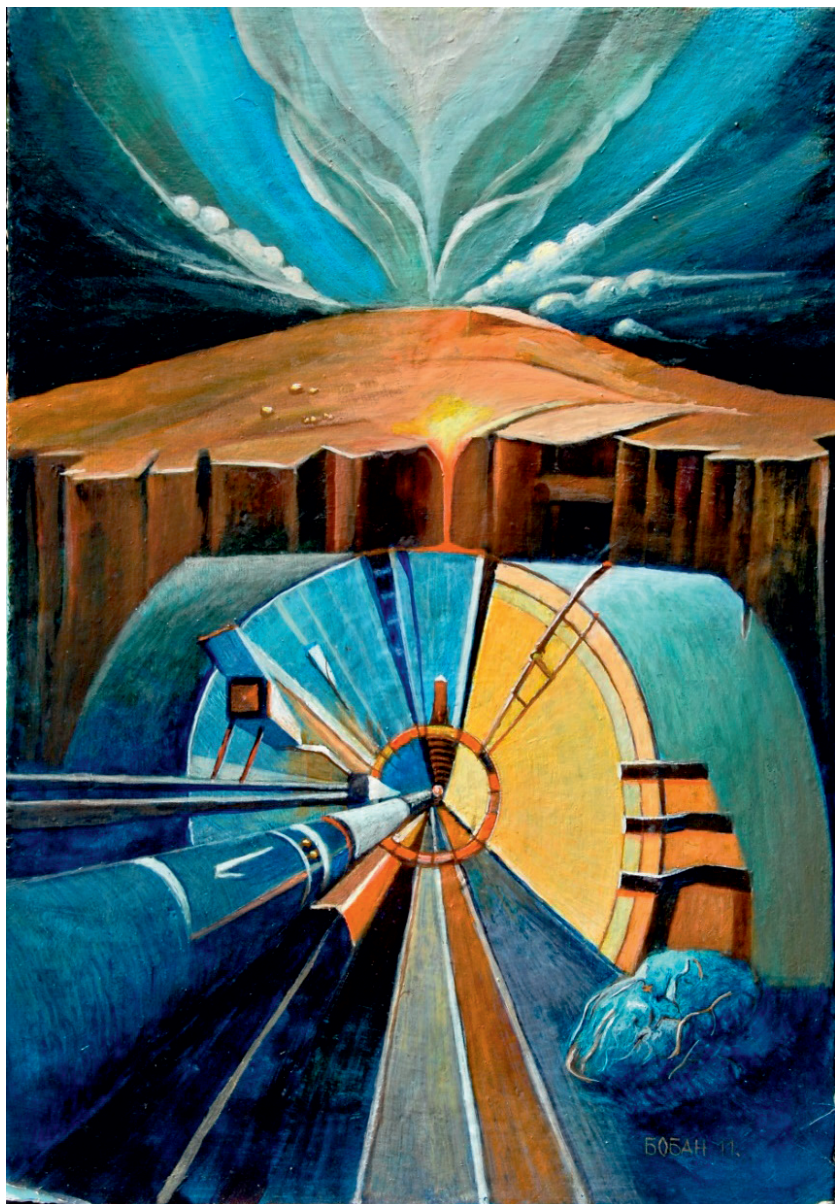
Божанска честица, 2011.