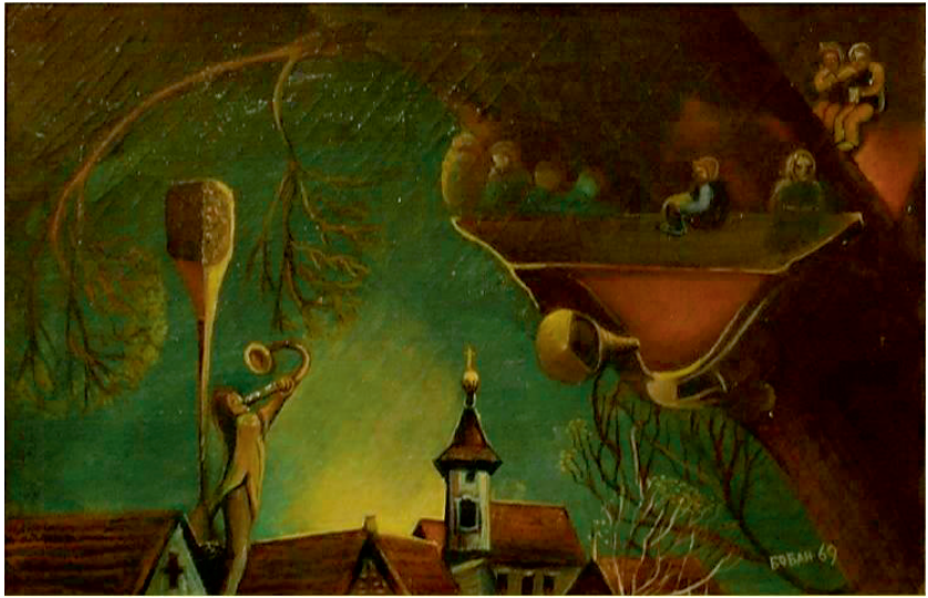
Баволска игра, 1969.