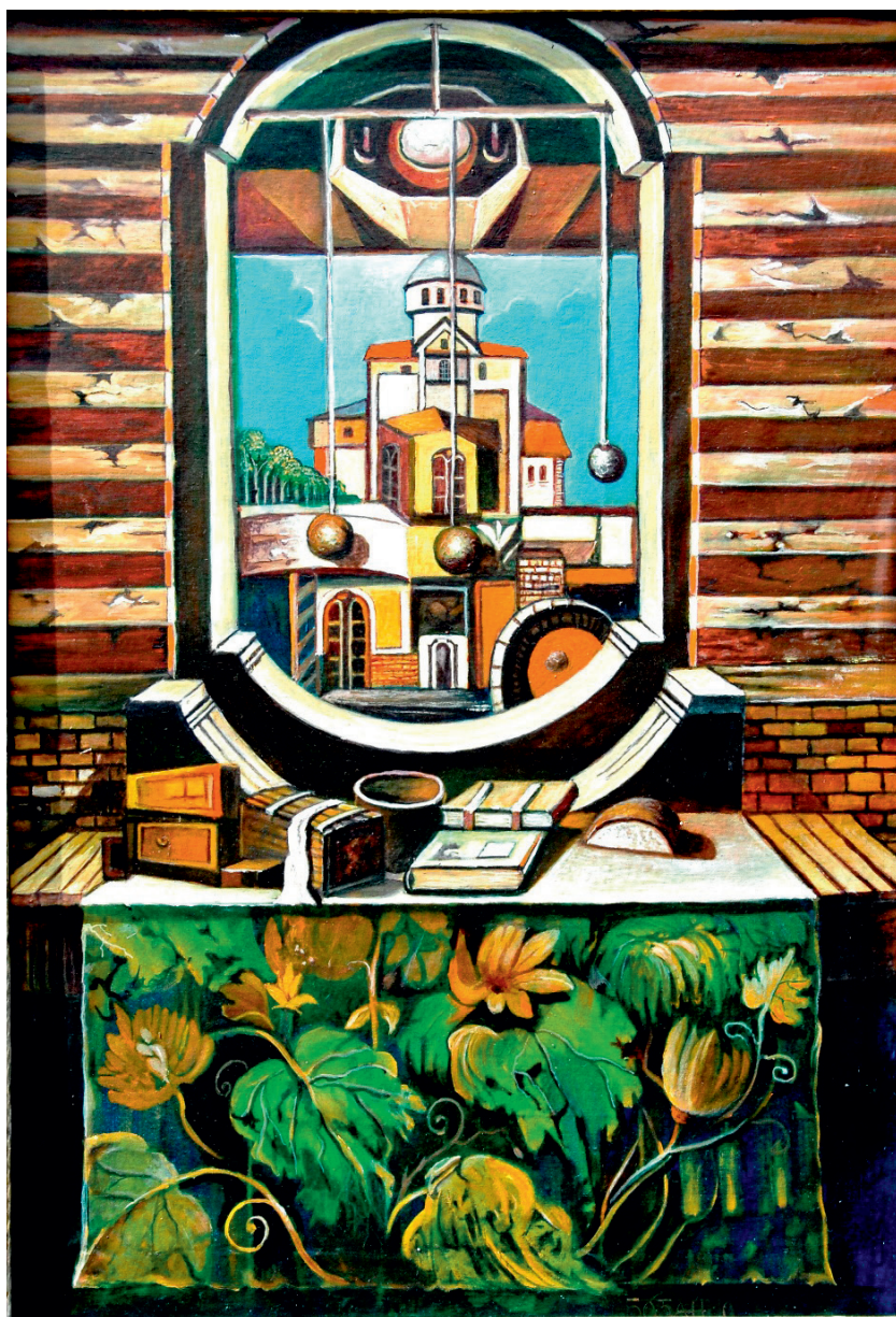
Све је у припреми, 2010.