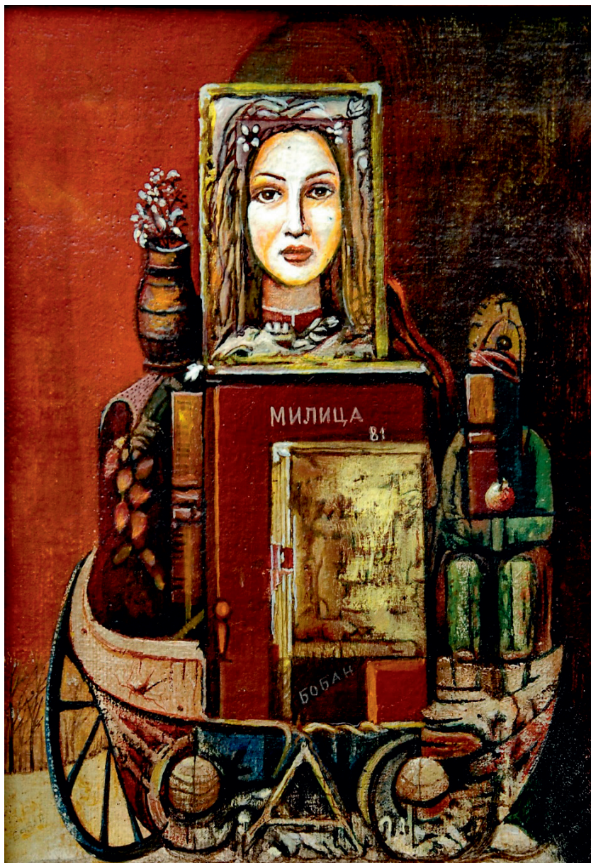
Милица моја, 1981.