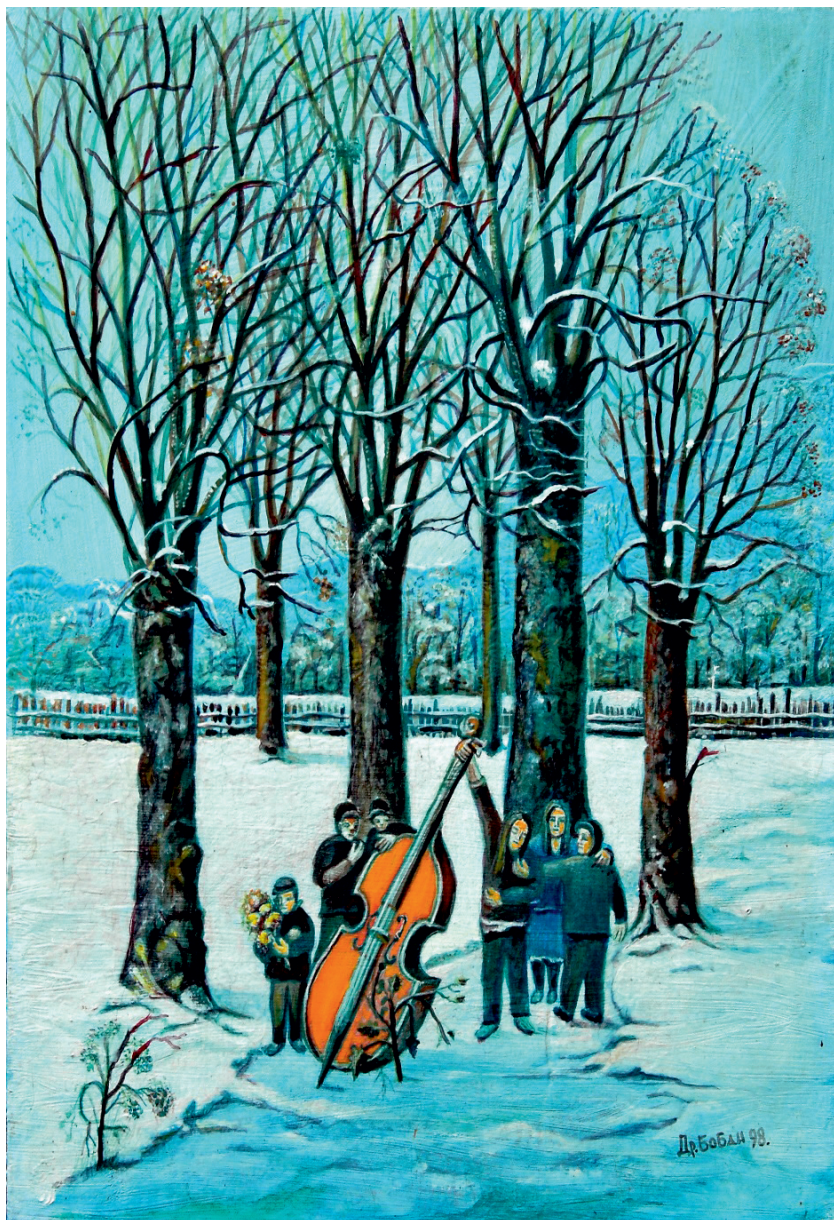
Растанак на Бадњи дан, 1998.