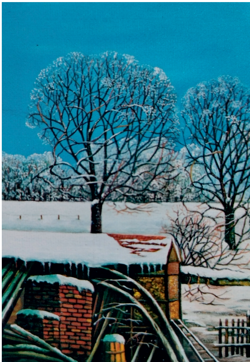
Зима у Човића пољу.