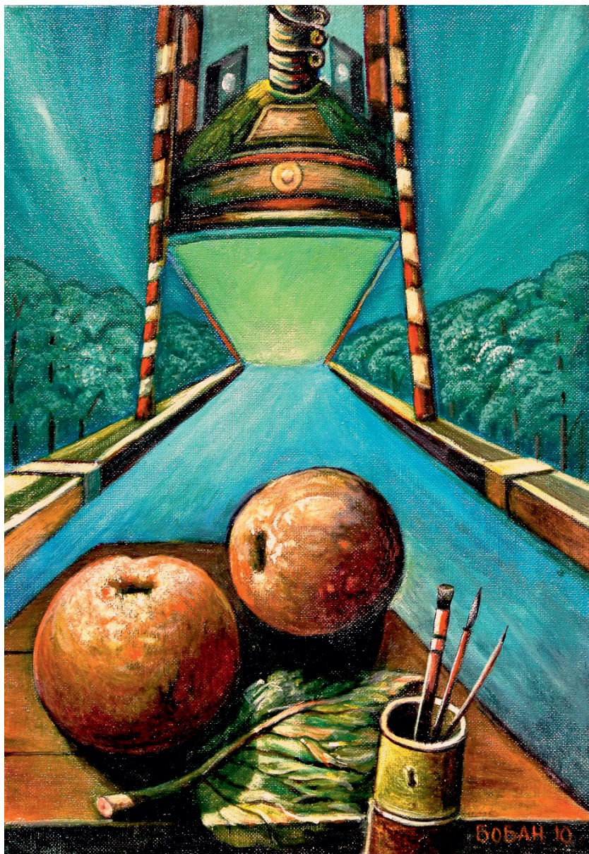
Дар од природе, 2010.