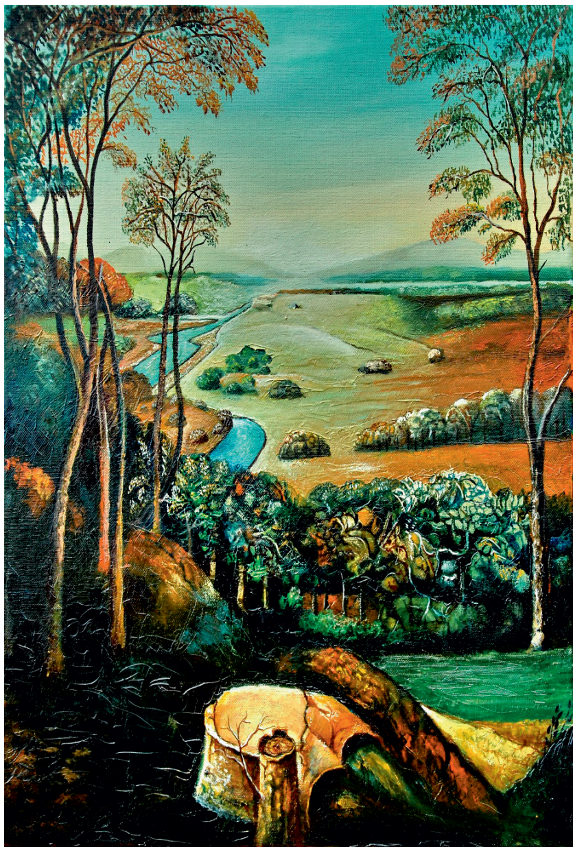
Поглед из Мачве.