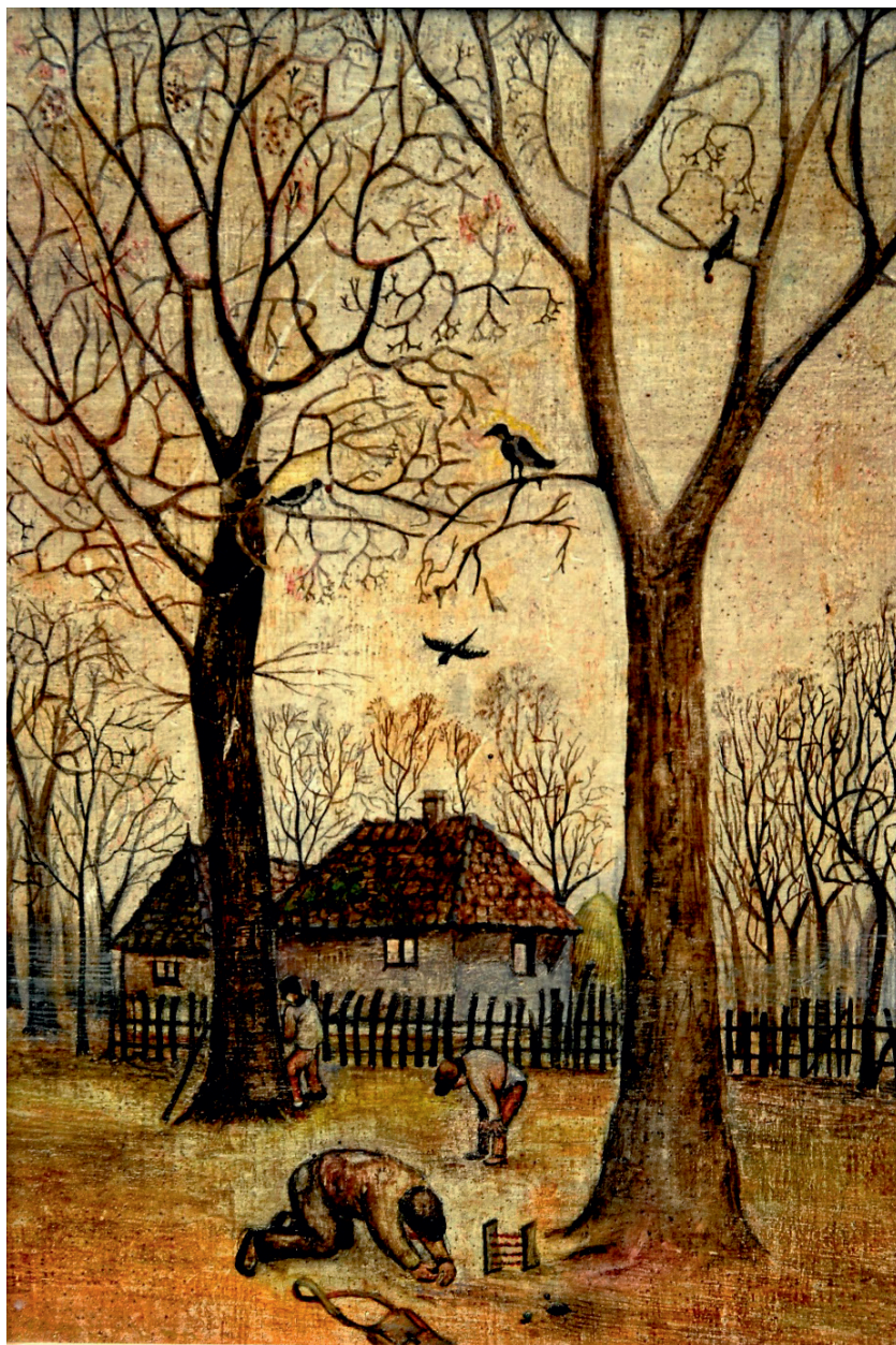
Беле Модранке кућа.