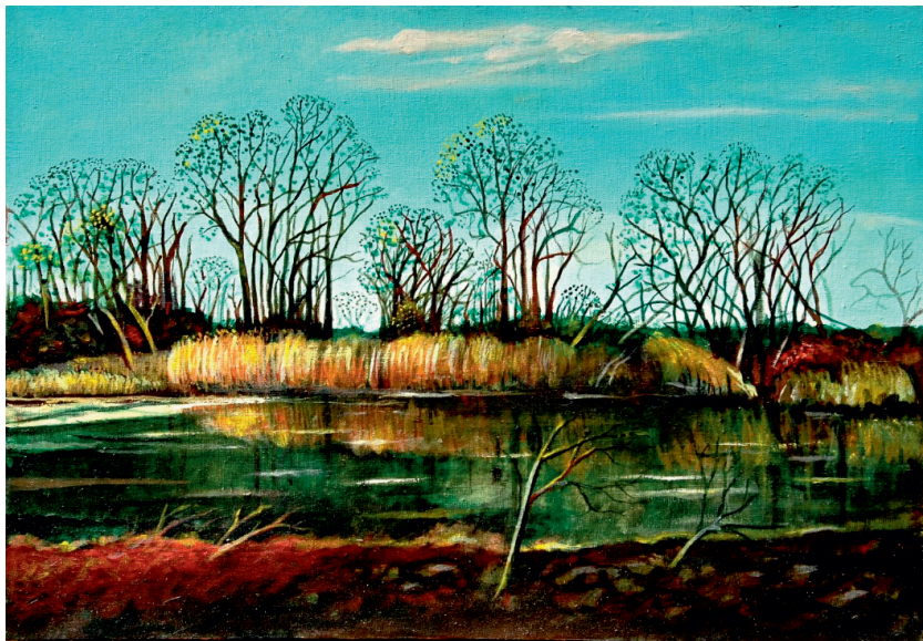
Пролеће у Засавици.