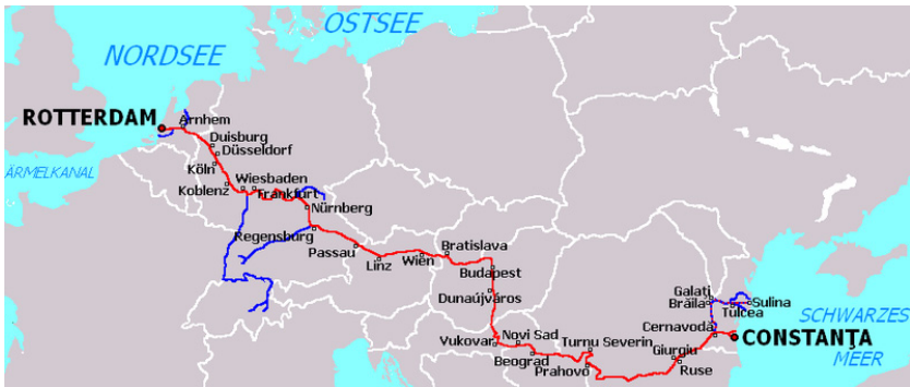
Мапа бр. 3: Рајна-Дунав: континентална геополитичка хоризонтала

почетка XIX века, за претпоставити је да се и иза Дунавске стратегије крије покушај промене постојећих правила, према којима је ово питање чврсто у рукама прибрежних земаља. Пројектом развоја унутрашњих пловних путева ( NAIADES ) ЕУ је већ пред себе поставила циљ стварања „делотворних речних комисија“. 31 Према овом плану, а који се базира на формирању тела попут Централне комисије за навигацију Рајном ( Commission Centrale pour la Navigation du Rhin ), биле би уведене обавезујуће правне норме за све прибрежне земље, успоставили би се јединствени стандарди пловидбе, претовара и утврдио образац тарифирања услуга, чиме се успоставља јединствен режим пловидбе Дунавом. Тиме би, суштински, „управљање Дунавом“ прешло из руку прибрежних земаља у руке ЕУ. 32