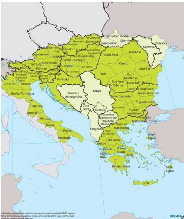
Мапа бр. 1: Регион „Југоисточна Европа“ у оквиру „Кохезионе политике ЕУ“ 2

Иако је импулс институционализацији трансграничне сарадње несумњиво дала ЕУ (а нешто касније се томе придружио и Савет Европе) у овај процес су укључене све европске земље, без изузетка, и чланице ЕУ и оне које то нису. Тако су, на пример, регионалне и локалне самоуправе Републике Србије формирале са партнерима из других држава чак пет прекограничних региона. Најстарији је „Еврорегија Дунав-Караш-Мориш-Тиса“, настао 1997. године, а у који улазе поједине општине из Србије, Мађарске и Румуније; потом „Еврорегион Дунав-Драва-Сава“ основан 1998. године, а који обухвата градове и општине на простору Србије, Хрватске, Мађарске и БиХ; па „српско-македонско-бугарски