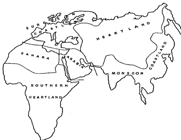
Карта 1: (Дез)интегративни потенцијал Мекиндерове Арабије („велике пукотине“) унутар шест „природних региона“ Светског острва