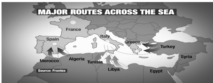
Карта 3: Три главна правца „Нове Велике сеобе народа“

Поред организованости и геополитичности, „Нова Велика сеоба народа“ показује опште демогеографске карактеристике многих масовних историјских миграција, али и неколико карактеристичних својстава, која су фрапантно аналогна Цвијићевим метанастазичким кретањима становништва Балканског полуострва, анализираних пре више од једног столећа 21 . Сходно томе, могуће је идентификовати: