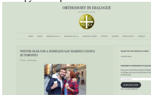
Фото 2. Скриншот