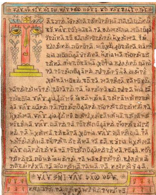
ФАКСИМИЛ ПИСМА СКОРИНЕ У КОМЕ СВЕДОЧИ О ПОСЕТИ МОЛДАВСКОЈ КРАЉИЦИ ЈЕЛЕНИ БРАНКОВИЋ 1512. ГОДИНЕ 20