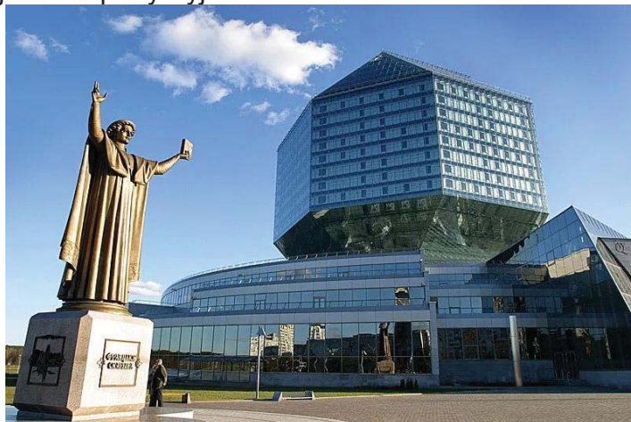
СПОМЕНИК СКОРИНИ ИСПРЕД НАЦИОНАЛНЕ БИБЛИОТЕКЕ БЕЛОРУСИЈЕ

Из низа доказа ми ћемо подсетити на један. Наиме, 1512. године један (Бело)Рус Франциско Скорина, штампар и културни радник, иначе (и) велики борац против уније на територији данашње Белорусије пише свом митрополиту да је био у Молдавији код краљице Јелене Бранковић (коју Скорина у писму још именује Јелена Српска), од које је добио новац за штампање књига којим треба да оповргне тврдње да су Срби изгубили на Косову због издаје Вука Бранковића. И ова чињеница да су Бранковићи владали Молдавијом се прећуткује.