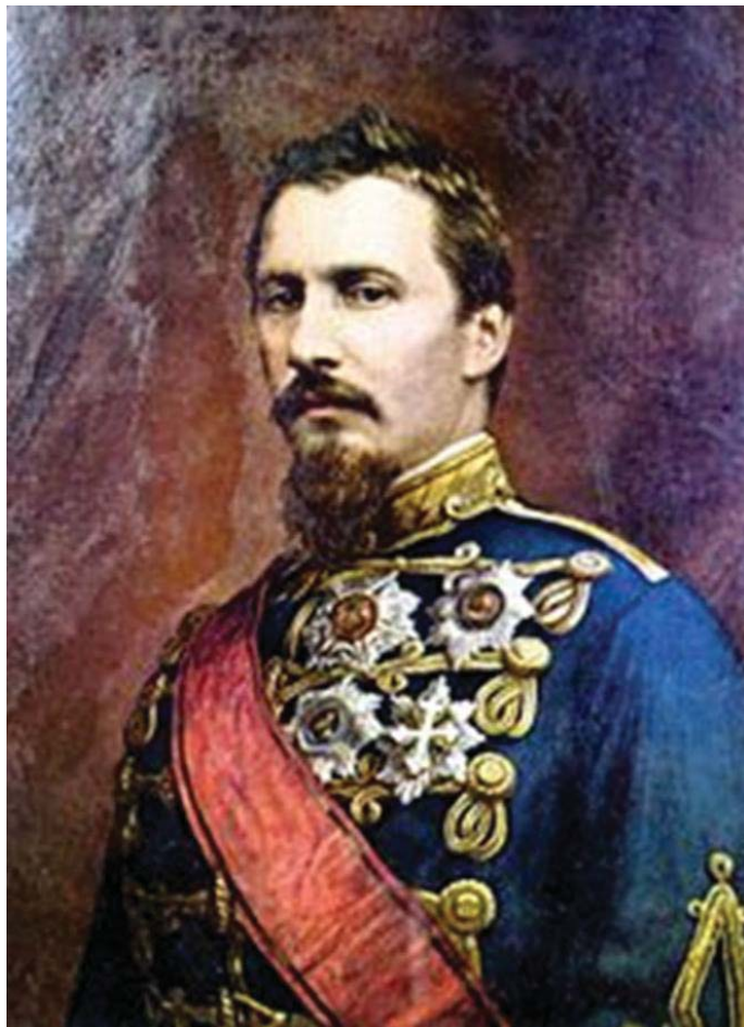
АЛЕКСАНДАР КУЗА ИЛИ ЈУЛИЈАН ОДУСТУПНИК

нген преузме нову државу и прогласи се краљем Румуније, 47 а изјашњавање о томе је одржано од 2. до 8. априла 1866. године. Тиме је власт и идеологија румунизма стабилизована, наравно, како смо већ, нагласили, уз помоћ невероватног насиља и социјалног инжењеринга.