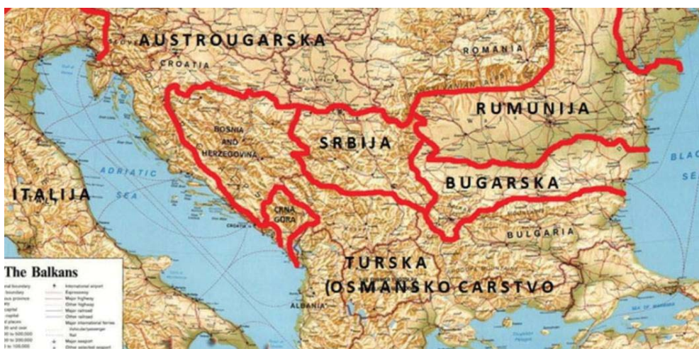
МАПА ПРВЕ РУМУНИЈЕ

штено-монаштво мисионари на овом подручју и успоставља своје парохије у црквене структуре), јер је ширење папског латинства и романизације вековни пројекат чија је једна од жртава био и сам народ Румуније. Једна од варијанти овог прастарог плана јесте и увођење НАТО «миротвораца» под плаштом војне сарадње на основу одавно парафираних Софа и Ипап споразума. Румунија би била пресрећна да јој из Вашингтона стигне зелено светло за војно преузимање контроле над целокупном делтом Дунава, старог Хитлеровог сна. Недостају само Србија и Молдавија.