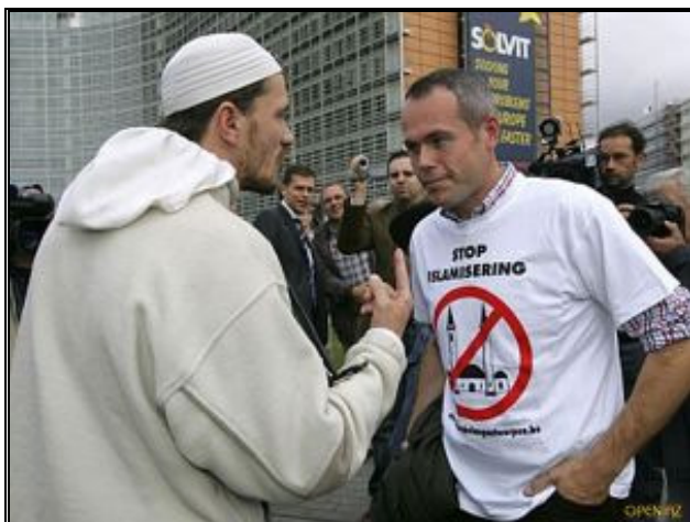
Европљанин са мајицом којом пропагира забрану градњи џамија у Европској унији