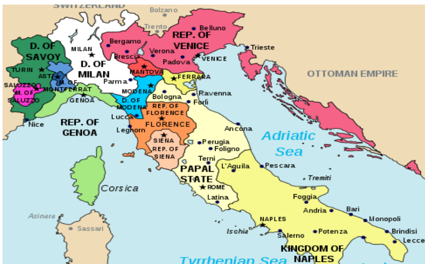
(Мапа 2, https://i.imgur.com/Im20xdq.png )

Почетак „Кандијског рата“ за Крит (1645-1699) између Турске и Венеције под крај Тридесетогодишег рата (1645) обележило је масовно опредељивања Срба на страну Венеције. Упркос губитка Крита Млетачка је стекла одређене територијалне уступке на рачун Османског царства управо на простору северне Далмације, где су Срби били већина, и у приморској Србији: у Грбљу и Паштровићима.