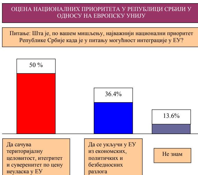
Слика број 3: Резултати истраживања у овом раду о оцени националних приоритета у односу на чланство Републике Србије у Европској унији

ни уврштено на листу приоритета одрживог развоја. Стога, резултати ставова и мишљења испитаника у овом истраживању, упућују на могућу стратешку и стратегијску погрешку и у одређивању приоритета у Националној стратегији одрживог развоја за период од 2009-2017 , јер поменута стратегија интеграцију Републике Србије у Европску унију третира као политички и стратегијски „приоритет без алтернативе“, а не само као важан спољнополитички циљ Републике Србије. Наведени ставови испитаника, потврђени су и другим истраживањима грађана у Републици Србији који тврде да је број „евроскептика“ у Републици Србији у порасту у 2012. години у односу на показатеље из 2011. године. 18)