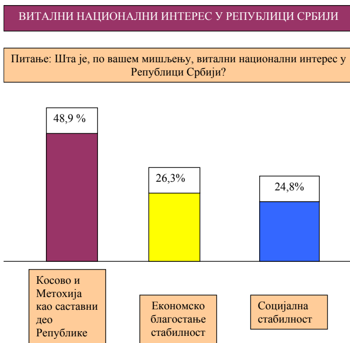
Слика број 1: Ставови испитаника о основним вредностима у друштву у Републици Србији

или универзалним вредностима, што треба, делимично, приписати структури узорка испитаника у којој доминирају, по образовању – особе са високом стручном спремом (Слика број 1). Имајући у виду разноврсност и репрезентативност узорка истраживања по националном и верском основу, значајан је резултат који упућује на чињеницу да је највећи број интервјуисаних особа предност дао опстанку државе и нације (одрживост), у односу на друге понуђене вредности.